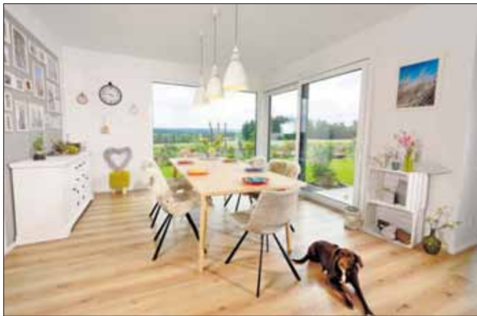
Der Essbereich des Zweifamilienhauses bietet dank der großen Fenster einen schönen Blick ins Grüne.

djd). Opa und Oma wohnen mit im Haus, aber in einer abgetrennten Wohneinheit. Die Einliegerwohnung wird vermietet und kann später bei Bedarf von einer Pflegekraft genutzt werden. Geht es um die Planung eines neuen Hauses, entscheiden sich immer mehr Bauherren für ein Zweifamilienhaus oder ein Haus mit Einliegerwohnung. Das bringt viele Vorteile mit sich. Auch in finanzieller Hinsicht.