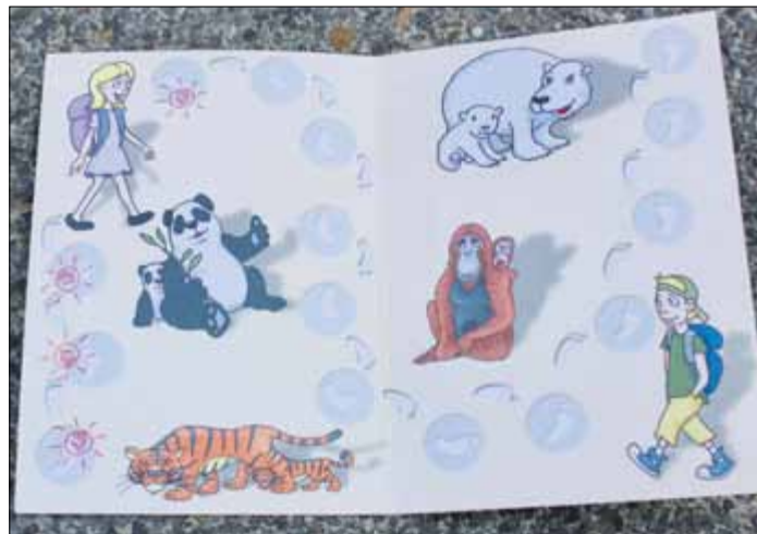
Ein „Zu Fuß zur Schule“-Pass