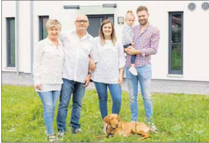
Generationenübergreifendes Wohnen liegt heute im Trend.