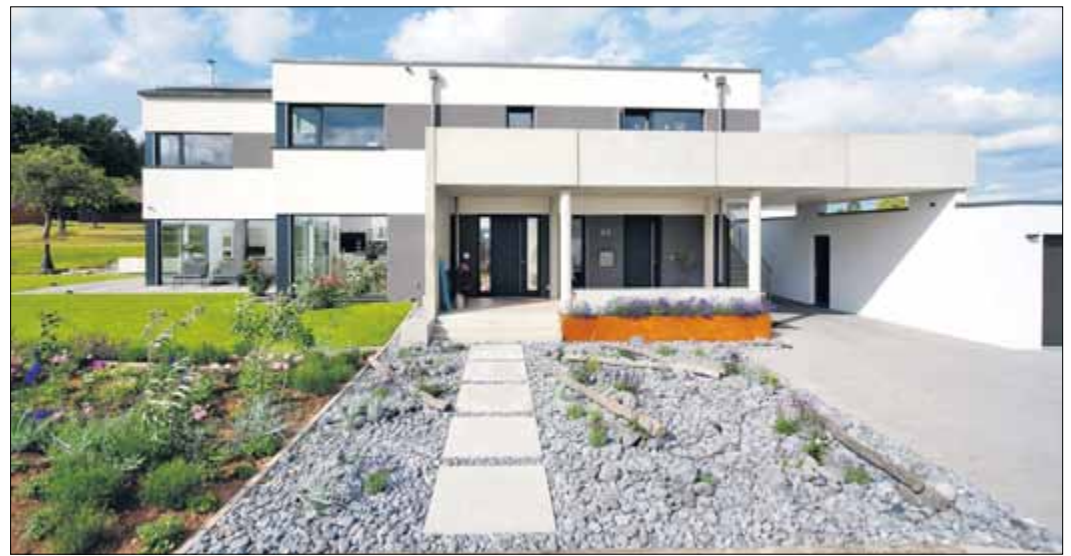
Mit Photovoltaik-Anlage, Wärmepumpe und einer großen Zisterne haben sich Angelina und Jens Kurras ein energiesparendes Haus in moderner Optik gebaut.

Bei einem KfW-Energieeffizienzhaus 40 Plus erhalten Häuslebauer auf diese Weise bis zu zweimal 30.000 Euro.