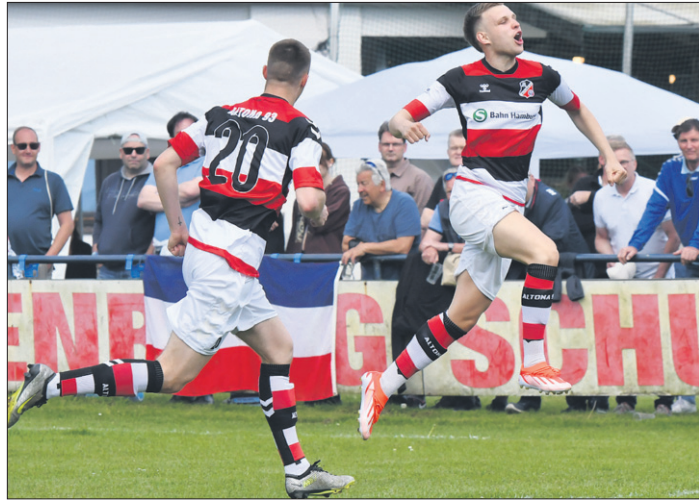
In Halstenbek sahen die Zuschauer ein spannendes Spiel. Mit einem 2:1-Sieg machte Altona 93 den Sack zu, Meister!

(19./70. Minute), HR verkürzte nur auf 1:2. Ein Spiel findet noch statt, am 17. Mai um 19 Uhr ist Süderelbe an der Griegstraße zu Gast und darf vermutlich auch noch etwas mitfeiern. Ein Spiel ist noch offen - nun, die Altoner Akteure könnten alle noch weglaufen, der Verein die Mannschaft abmelden und der HFV die Altonaer disqualifizieren. Trotz dieser vielen Mög-