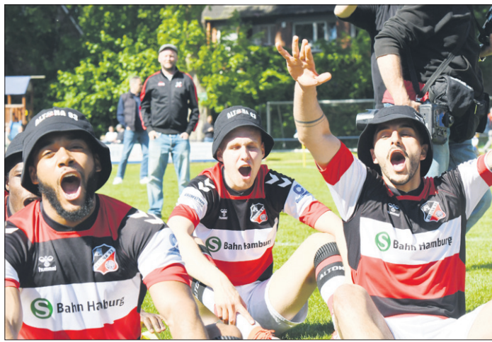
Nach dem Schlusspfiff wurde gejubelt, Oberliga-Meister Altona 93

lichkeiten, die Meisterschaft noch zu verlieren, darf man Altona 93 an dieser Stelle ganz tüchtig zum Titelgewinn in der Oberliga gratulieren. Tatsächlich ist der Titel für Altona 93 auch etwas besonderes – denn so oft hat Altona 93 diese Meisterschaft gar nicht gewonnen – meist spielte man ja höherklassig. Aber wir freuen uns, dass die HFV-Vertreter den Meistertitel vorsorglich am nächsten