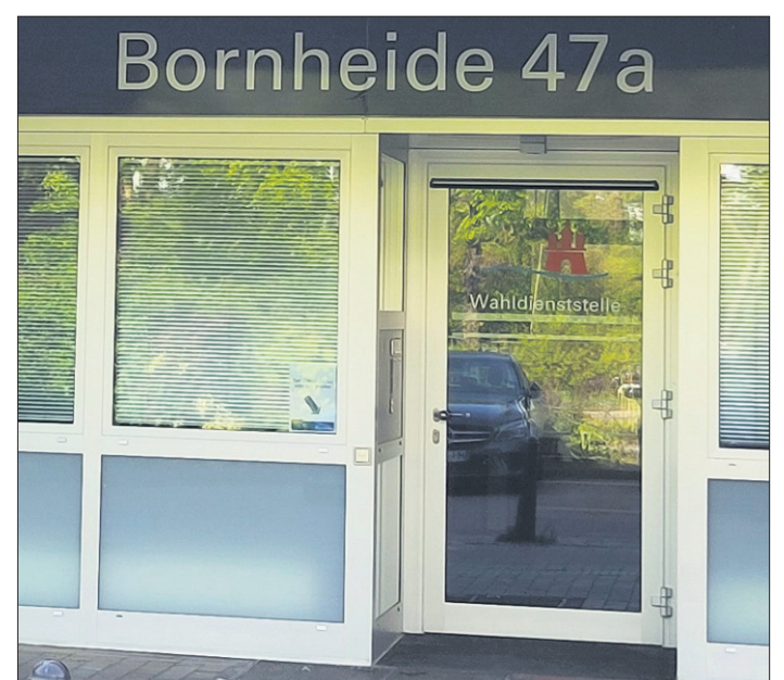
Die Wahlbenachrichtigung in Osdorf. Hier kann die Briefwahl direkt beantragt und sofort gewählt werden.

Der Wahlbenachrichtigung liegen außerdem Musterstimmzettel bei. Der Grund für die Versendung des Musterstimmzettels für die Bezirksversammlungenwahl ist das stark personalisierte Wahlrecht, das fünf Stimmen für den Bezirkslisten-Stimmzettel und fünf Stimmen für den Wahlkreislisten-Stimmzettel vorsieht. Jede Partei oder Wählervereinigung kann bis zu 60 Kandidierende für ihre Bezirksliste und je nach Größe des Wahlkreises bis zu sechs beziehungsweise zehn