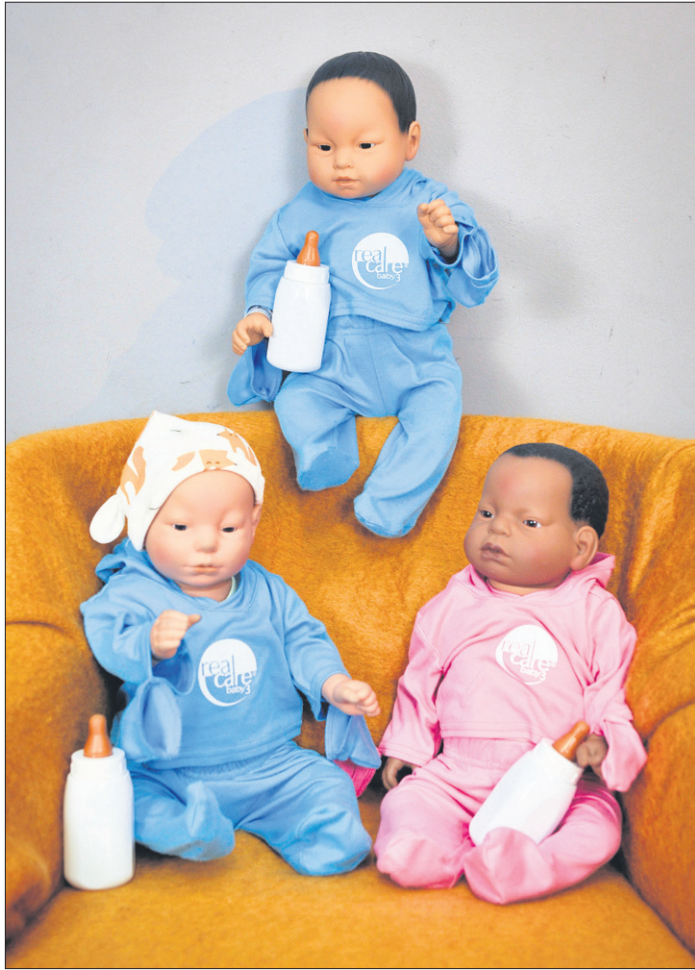
Mithilfe der realitätsnah aussehenden Babysimulatoren erleben die am Projekt teilnehmenden Jugendlichen hautnah, wie sich der Alltag mit Baby anfühlt.

Kleinkindern, Erziehung und Elternverantwortung. Aber auch das Hilfesystem für Schwangere und junge Eltern in Osdorf und Lurup wird vorgestellt, begleitet von Besuchen in der Mütterberatung, dem EKIZ Lurup, der Elternschule Osdorf und dem Kennenlernen weiterer sozialräumlicher Angebote in den Stadtteilen.