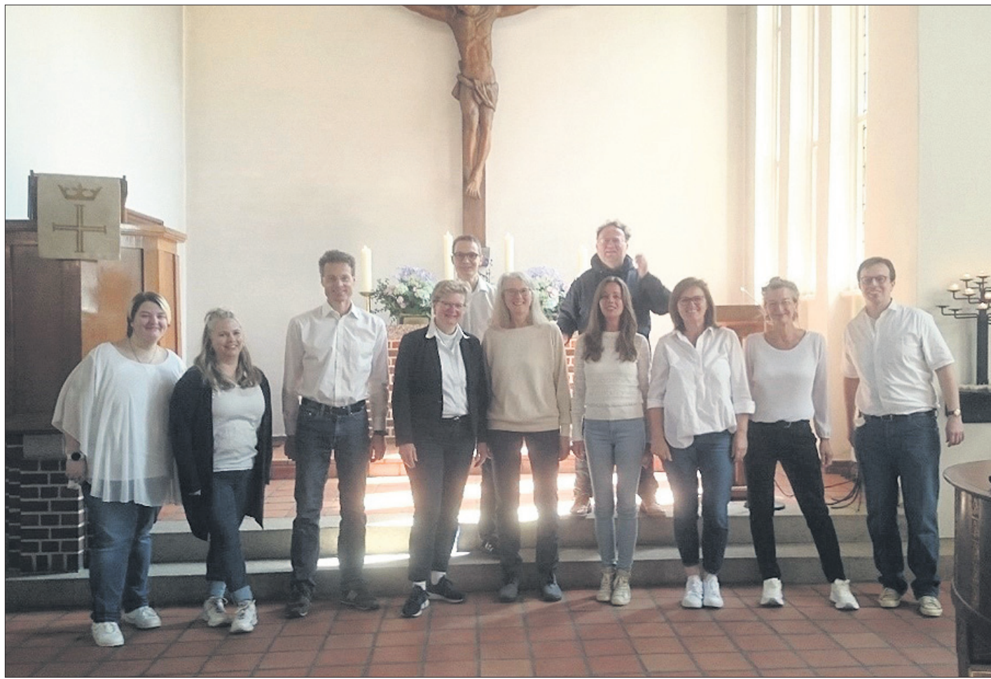
Die PopChor Sing-it! Schola im Gottesdienst zu Christi Himmelfahrt in der Sülldorfer St. Michaelskirche am 18.05.2023

Am Sonntag, den 26. Mai 2024, darf man gespannt sein auf bekannte Stücke und viele neu erprobte Lieder des PopChors Sing-it!. Der Chor bringt Stücke mit, die von Frühling und Frühlingsgefühlen zeugen und sehr viel Dynamik, passend zur im Frühling erwachenden Natur bieten. Also für den sogenannten Wonnemonat Mai! Freuen kann man sich auf karibische Rhythmen des Black