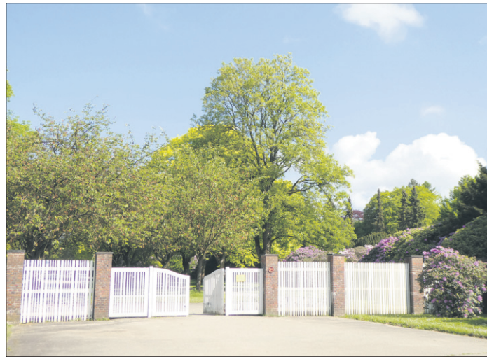
Friedhofseingang an der Stadionstraße.

der Bezirksversammlung Altona schaffen. Auf Antrag der Fraktion DIE LINKE Altona beschloss das Gremium Anfang Mai: Die Verkehrsbehörde soll gemeinsam mit dem Hamburger Verkehrsverbund prüfen, in welcher Form der Haupteingang des Friedhofs an das Buslinienangebot angebunden wird. Karsten Strasser: „Gerade für jene mit Mobilitätseinschränkungen, wäre eine regelmäßig frequentierte Bushaltestelle vor dem Haupteingang des Hauptfriedhofs Altona sehr hilfreich. Wir fordern, dass die Verkehrsbehörde zum nächsten Fahrplanwechsel eine bessere Busanbindung des Friedhofs realisiert.“