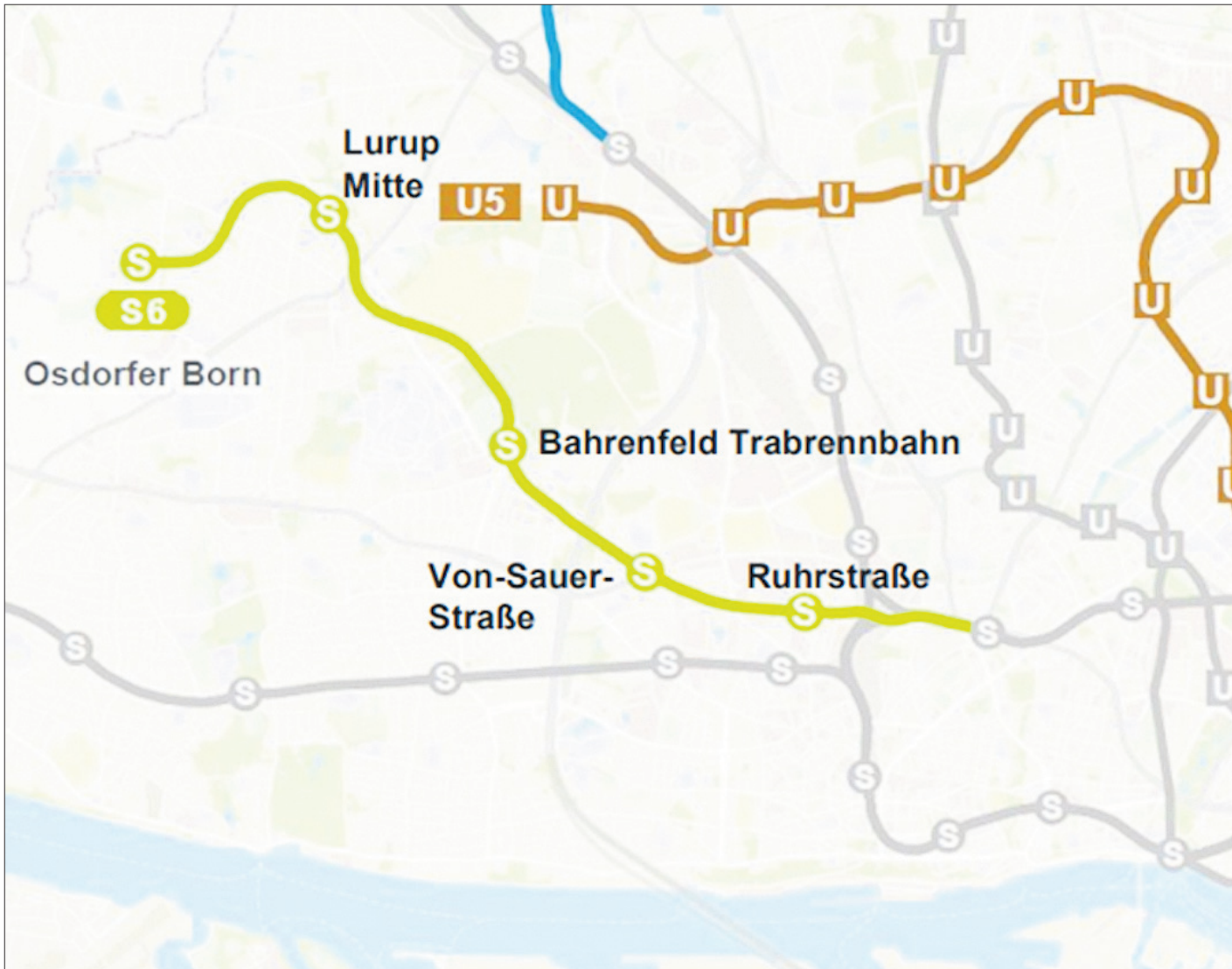
Die aktuelle Version der Streckenführung der S6 (ehemals S32) Darstellung: HOCHBAHN (Bearbeitung: BVM), Kartengrundlage: Open Streetmap

nelbohrer vorangetrieben, aber für die Haltestellen müssen riesige Baugruben errichtet werden. Offen ist, wann mit dem Bau überhaupt begonnen werden kann, und auch noch, ob sich der Bund und in welcher Höhe an dem S-Bahn-Bau beteiligt. Kritiker aus anderen Parteien sind eher skeptisch und glauben nicht, dass die Bahn noch vor 2045 in Richtung Westen fährt. rcl