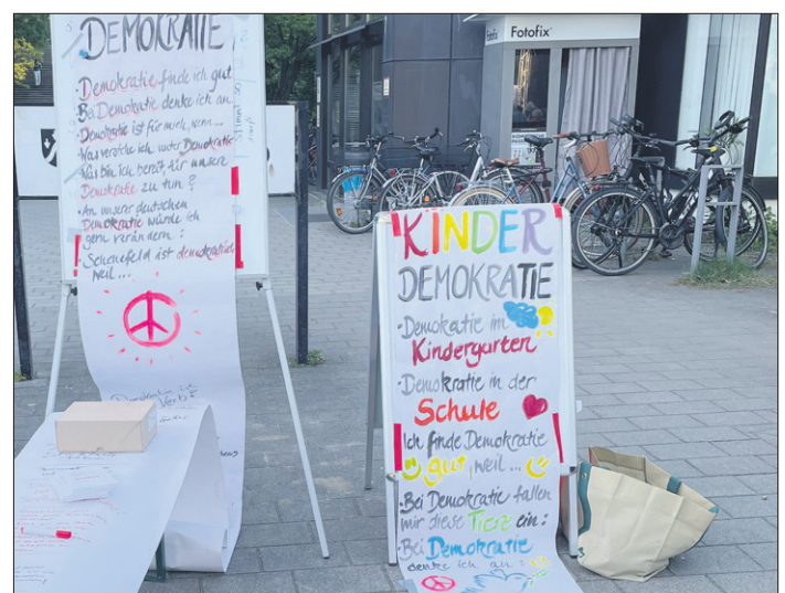
Der Demokratiestand der in der Ratsversammlung vertretenen Parteien.