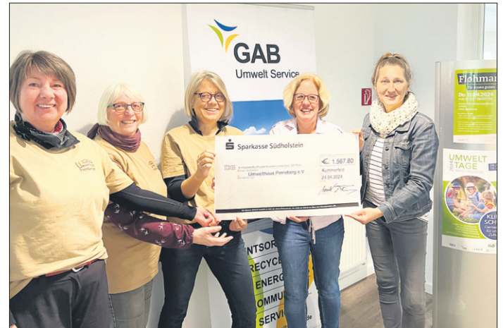
Glückliches Team vom Umwelthaus Pinneberg e. V. bei der Scheckübergabe am 24.4.2024

Die GAB und der Kreis Pinneberg veranstalten am 5. September in der Zeit von 14:30 bis 18 Uhr einen Flohmarkt auf dem Gelände der Wertstoffannahme in Quickborn (Güttloh 1-5, 25451 Quickborn). Die Erlöse kommen einem regionalen Verein aus dem Bereich Natur- und Umweltschutz zugute. Bewerbungen sind ab sofort möglich! Jeden Tag landen auf den Recyclinghöfen im Kreis Pinneberg Gegenstände, die sich noch in einem sehr guten Zustand befinden. Oft sind sie originalverpackt, voll funktionsfähig und viel zu schade, um sie einfach wegzuerwerfen. Das Flohmarktkonzept unterstützt die Wiederverwendung oder Mehrfachnutzung von Produkten, wodurch Abfälle vermieden werden. Nachdem die ersten Flohmärkte im letzten Jahr so gut angenommen wurden, findet das Gemeinschaftsprojekt der GAB und des Kreises Pinneberg in diesem Jahr bereits zum zweiten Mal statt. Im Angebot gibt es auch wieder Elek-