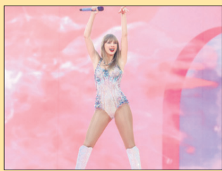
Ausnahmestand im Volkspark durch Taylor Swift Seite 3