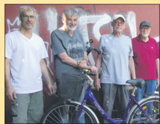
Schenefelder Fahrradwerkstatt auf Suche Seite 11