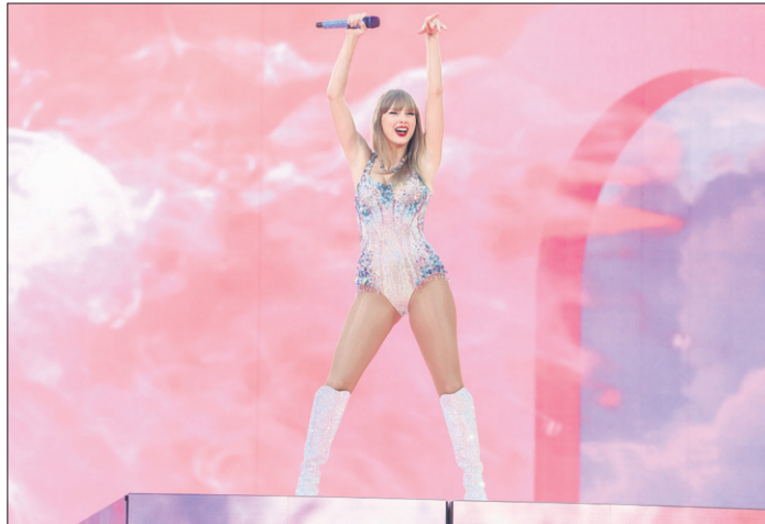
Taylor Swift auf ihrer „Eras“-Tour

mer im Volksparkstadion diesmal eindeutig zu kurz ausfiel. Aufgrund der Fußball-Europameisterschaft waren allerdings keine weiteren Musik-Veranstaltungen möglich. 2025 wird das anders sein. Für den nächsten Sommer stehen schon einige Musik-Stars in der Warteschleife. rcl