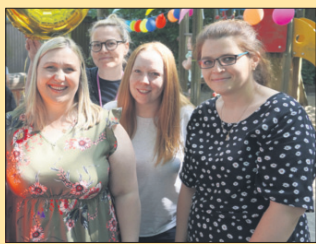
Jubiläum der AWO Kita Morgenröte in Lurup Seite 3