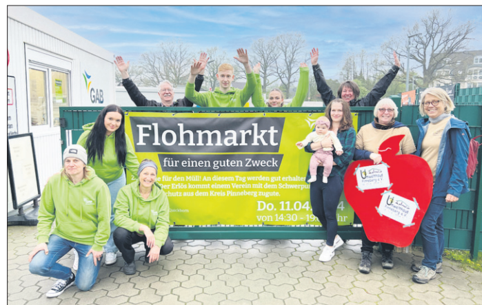
Frohe Gesichter nach dem erfolgreichen Flohmarkt am 11. April 2024