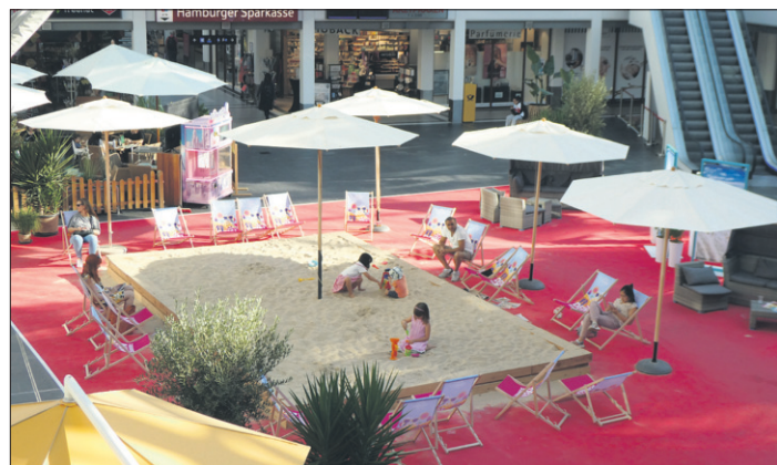
Sommer-Flair auf dem Marktplatz im Stadtzentrum

gehört zu den größten Einkaufszentren im Hamburger Westen. Das Einzugsgebiet umfasst sowohl die westlichen Hamburger Stadtteile als auch die im Speckgürtel liegenden Städte und Gemeinden von Schleswig-Holstein. Auf rund 37.000 Quadratmetern und drei Etagen befinden sich etwa 90 Geschäfte, Dienstleister, Büros und Praxen, darunter auch eine der fünf staatlich konzeptionierten Spielbanken in Schleswig-Holstein. Ankermieter sind REWE, TK Maxx, H&M, New Yorker und Deichmann. VÖLKELE ist seit 2011 mit dem Centermanagement und Leasing des Stadtzentrum Schenefeld beauftragt.