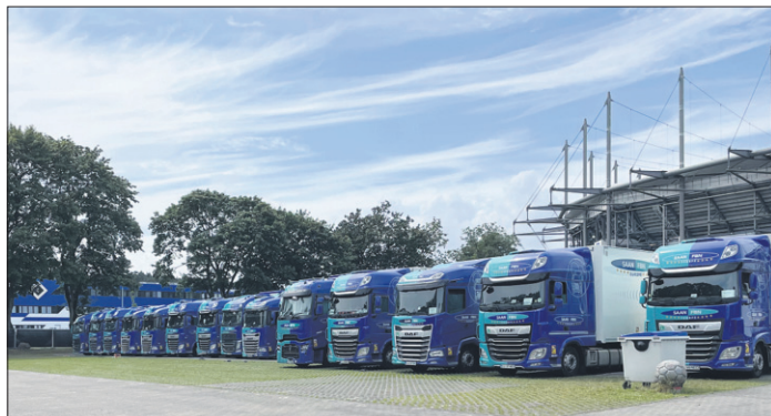
110 dieser Trucks standen auf dem Parkplatz vorm Volksparkstadion und auf dem benachbarten Busparkplatz. Sie werden für den Transport von Bühnenaufbau und Konzerquipment benötigt.