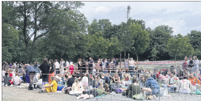
Einlass ins Stadion war um 16 Uhr. Die ersten Fans kamen morgens um 6 Uhr, um dann beim Einlass die besten Plätze vor der Bühne zu ergattern, damit sie ihrem Idol nah sein konnten.