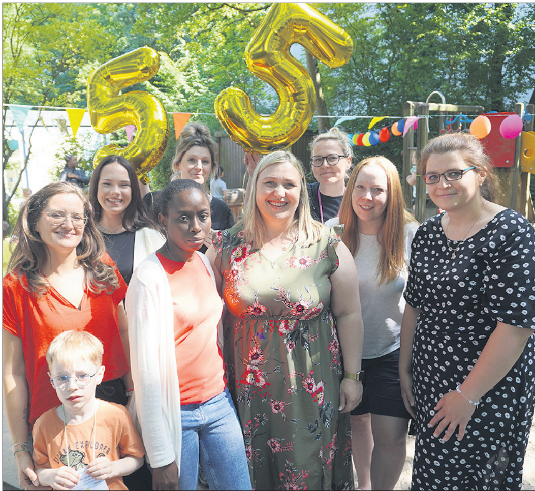
Die AWO Kita Morgenröte hat zum 55-jährigen Jubiläum ein großes Sommerfest gefeiert.

In der Kita Morgenröte spielen, erfahren und experimentieren die Kita-Kinder in interessant gestalteten Räumen