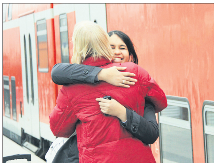
Als Gastfamilie internationale Freundschaften fürs Leben schließen.

Wer einen Jugendlichen bei sich aufnehmen möchte, kann sich – gern möglichst bald – bei YFU melden: Telefon: 040 227002-0, E-Mail: gastfamilien@yfu.de . Weitere Informationen auch im Internet unter: www.yfu.de .