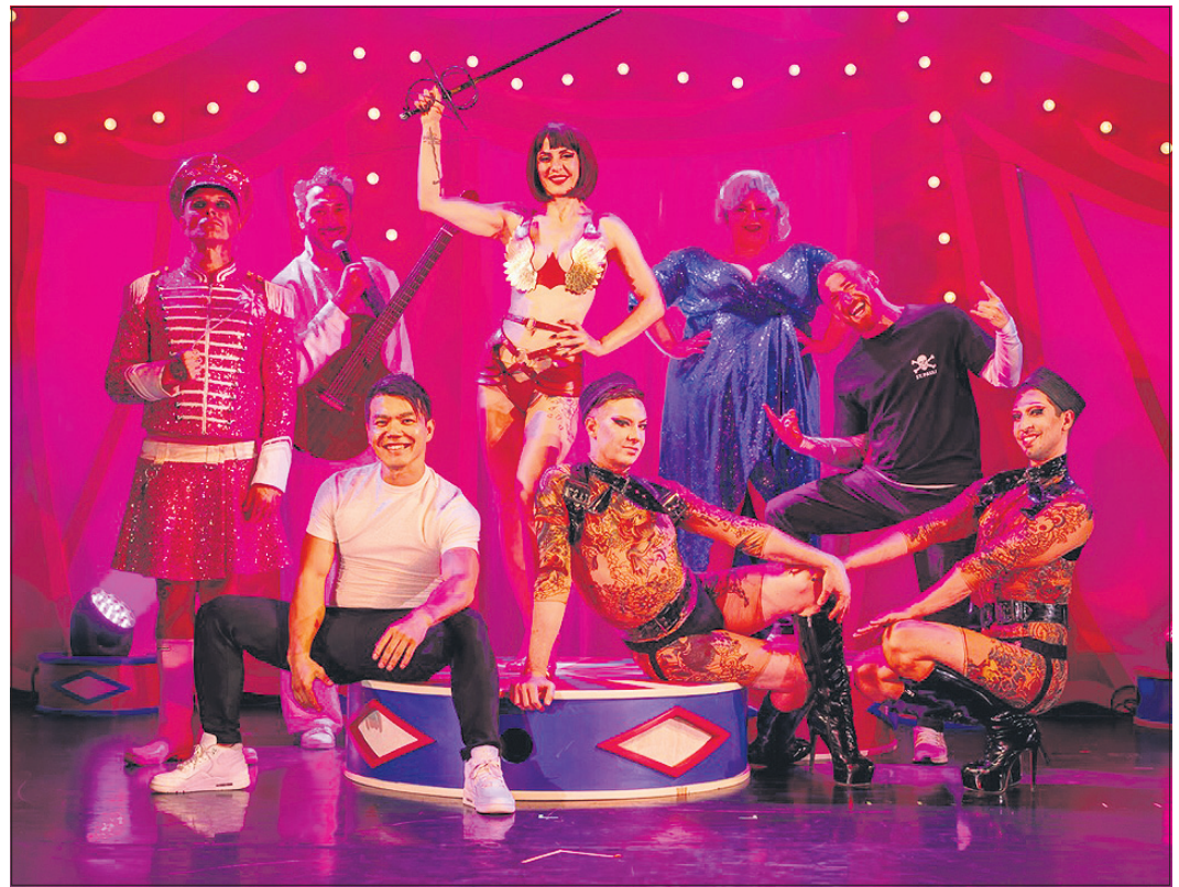
Teile des Ensembles