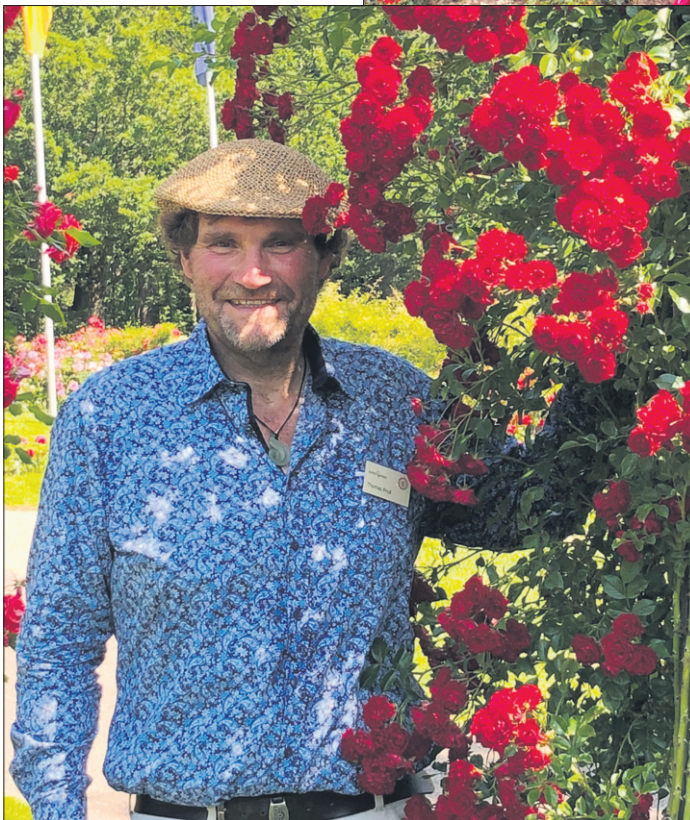
Kordes Rosen, Thomas Proll Crimson