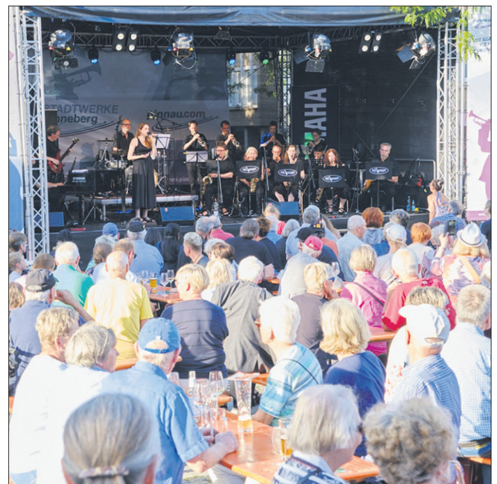
Wie im Vorjahr kann es auch in diesem Jahr wieder hoch her gehen.

Das Festival ist wie immer umsonst und draußen. Die Besucher benötigen keine Anmeldungen oder Tickets, aber sie dürfen sich sehr gern einen Pin kaufen. Mit dem Erwerb eines Pins für 10 Euro - die jährlich wechselnde Anstecknadel unterstützt man das Festival finanziell. Der Pin dieses Jahres ist eine Blockflöte. Ihn gibt es erstmals in zwei Farbvarianten: Holzfarben für die Traditionalisten sowie lila für diejenigen, die es moderner mögen. Der SummerJazz ist mit allen Informationen auf www.summerjazz.de zu erreichen.