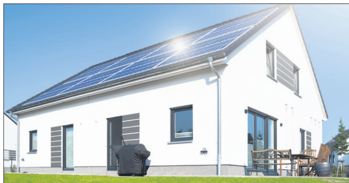
Ungenaue Angaben in der Bau- und Leistungsbeschreibung müssen Bauinteressenten nicht akzeptieren.

(djd). Die Bau- und Leistungsbeschreibung eines Eigenheim-Neubaus ist mit entscheidend für die Einhaltung der Vorgaben aus dem Gebäudeenergiegesetz (GEG). Bauherren sollten unspezifische Angaben kritisch hinterfragen und detaillierte Nachweise zu Dämmstoffen, Fenstern und Türen sowie Heiz- und Lüftungssystemen fordern. Allgemeine Formulierungen wie „energiesparende Bauweise“ oder „hochwertige Dämmstoffe“ bieten keine ausreichende Sicherheit. Experten empfehlen, die Bauunterlagen von einem sachverständigen Berater prüfen zu lassen.