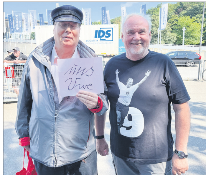
Zwei treue HSV-Fans aus Lurup und Volksdorf