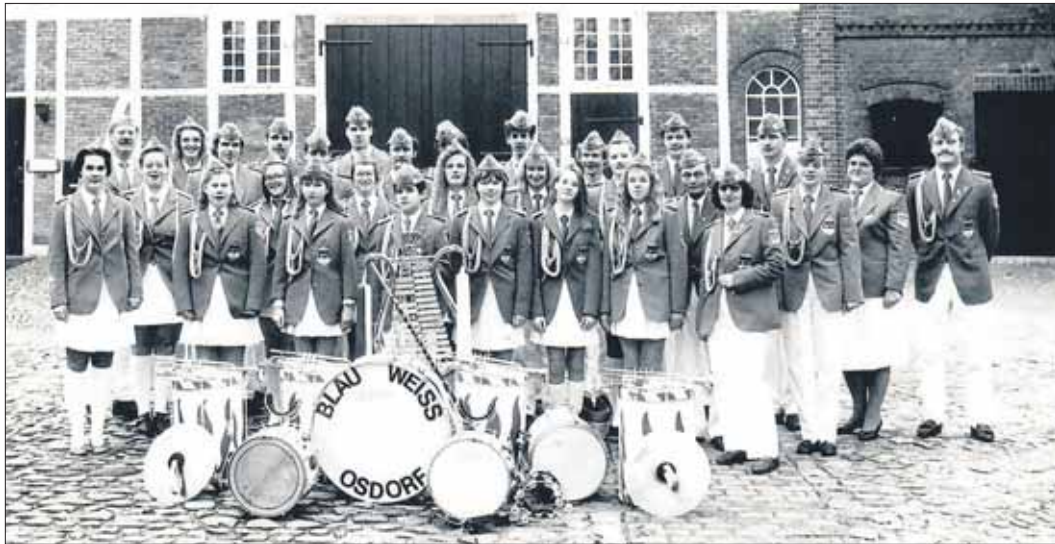
Blau Weiss Osdorf auf dem Heidbarghof

teilgenommen und auch Reisen zum Beispiel in die USA unternommen. 2003 hat sich der Verein in Freundschaft vom TUS Osdorf getrennt und wurde als eingetragener Verein eigenständig. Es wurden weiter unzählige Auftritte bestritten und Reisen unternommen. Aktuell besteht der Verein aus 25 aktiven Mitgliedern sowie zwei Anfängerinnen. Der Verein würde sich über weiteren Nachwuchs sehr freuen. Weitere Informationen findet man auf der Homepage: www.blau-weiss-osdorf.de und in den sozialen Medien bei Instagram und Facebook.