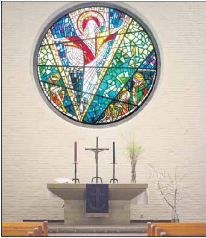
Altar mit Christusfenster