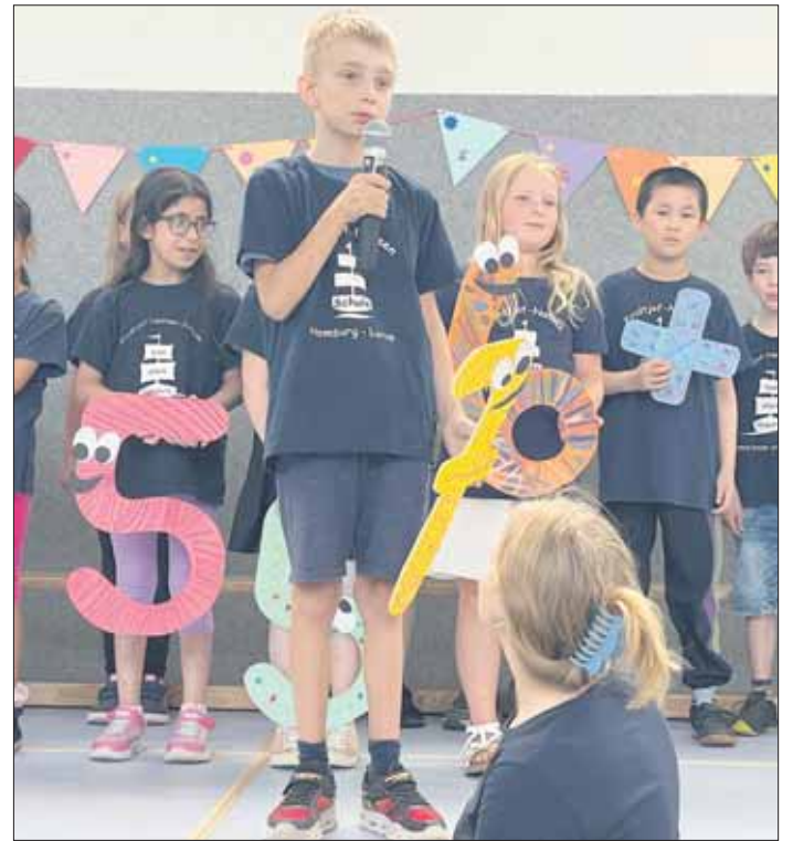
Klasse 3 g bei der Probe

waren Sorgen und Kummer vergessen. Ihre Kinder werden sich später an einem wunderschönen Einschulungstag erinnern. Maren Schamp-Wiebe