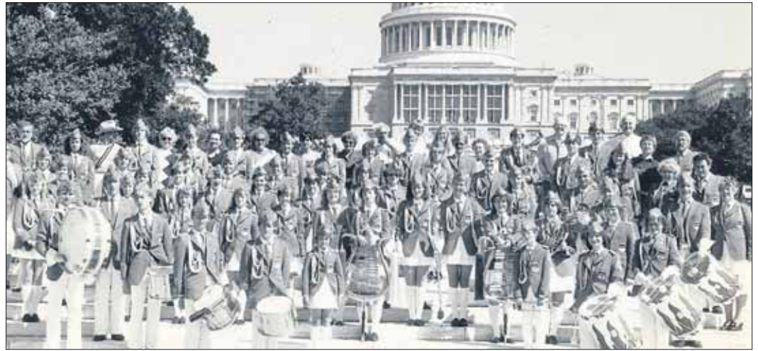
Auf der USA-Reise vor dem Capitol

50 Jahre Spielmanns- und Fanfarenzug Blau Weiss Osdorf! Das muss gefeiert werden! Immerhin ist er der letzte Spielmannszug im Hamburger Westen. Anlässlich des Jubiläumfestes am 14. und 15. September werden zahlreiche Gäste erwartet. Am 14. September um 15 Uhr starten die Feierlichkeiten mit einem Konzert in der St. Simeon Kirche in der Dörpfeldstraße in Osdorf mit anschließendem Empfang für geladene Gäste. Am 15. September ist ein Sternmarsch und ein Gastspiel geplant. Erwartet werden die Faslamgarde Stöckte (Karnevals-