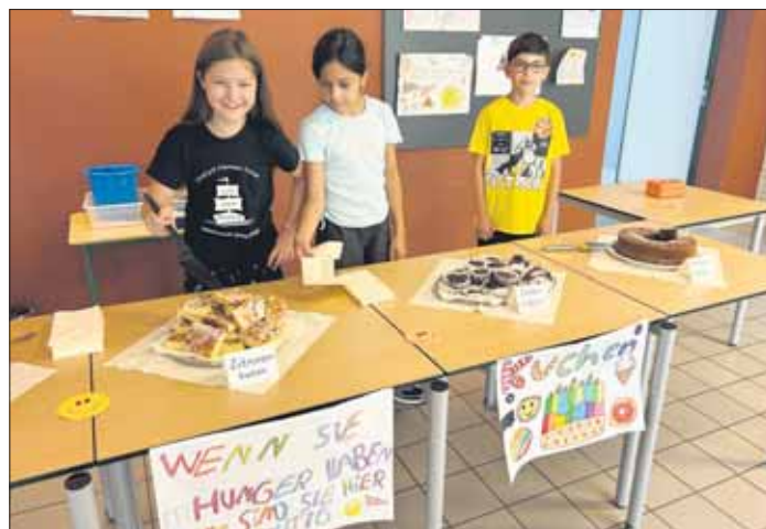
Kuchenverkauf bei der Einschulung