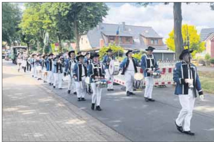
Der Spielmannszug in Wilstedt

tanzgruppe), die Faslambrüder Stöckte (Karnevalsverein), die Spielmannszüge aus Hamburg-Harburg und Ahrensburg als Spielgemeinschaft, die Spielmannszüge aus Tonndorf-Lohe, aus Osdorf bei Kiel, aus Hinschenfelde, der Jugendspielmannszug Langenhorn und natürlich der benachbarte Spielmannszug Meissner aus Schenefeld. Jeweils zu zweit werden die Vereine ab 11.30 Uhr aus drei Richtungen als "Sternmarsch" in Richtung Sportplatz des TuS Osdorf am Blohmkamp marschieren. Startpunkte werden der Mohnstieg, der Eichenplatz und