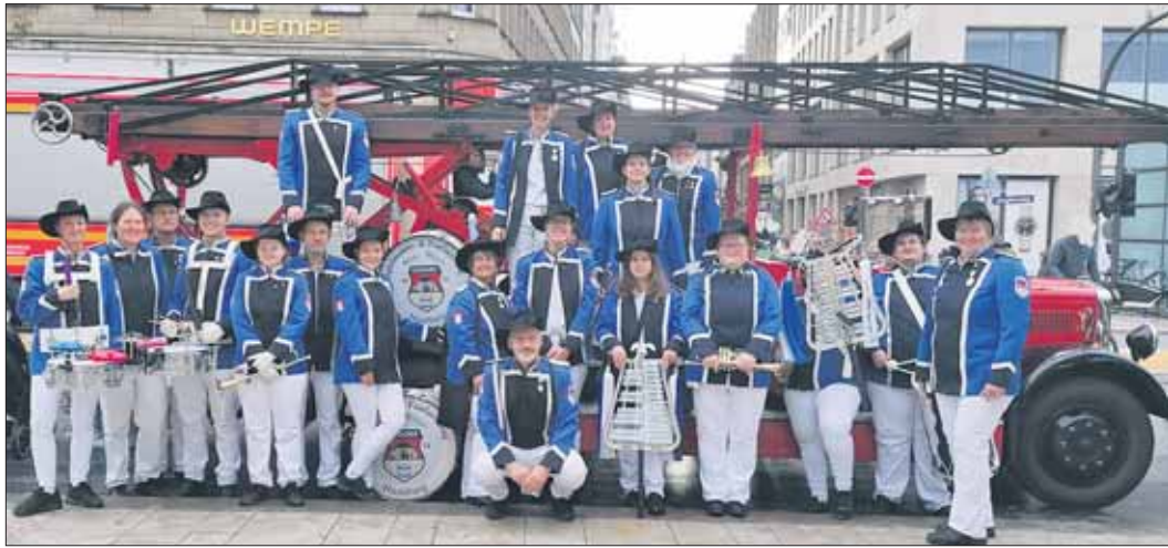
Blau Weiss Osdorf auf Tournee