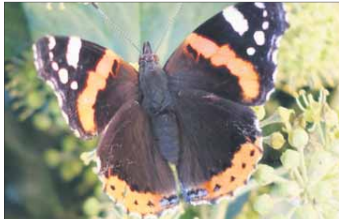
Ein „Admiral“ in einem Luruper Garten.

guttut. Am kommenden Sonnabend, den 14. September, soll die Fläche aufgeräumt werden. Die Schmetterlinge freuen sich über jede oder jeden, der dabei in der Zeit von 13 bis 15 Uhr helfen oder auch nur neugierig ist und die Fläche kennenlernen möchte.