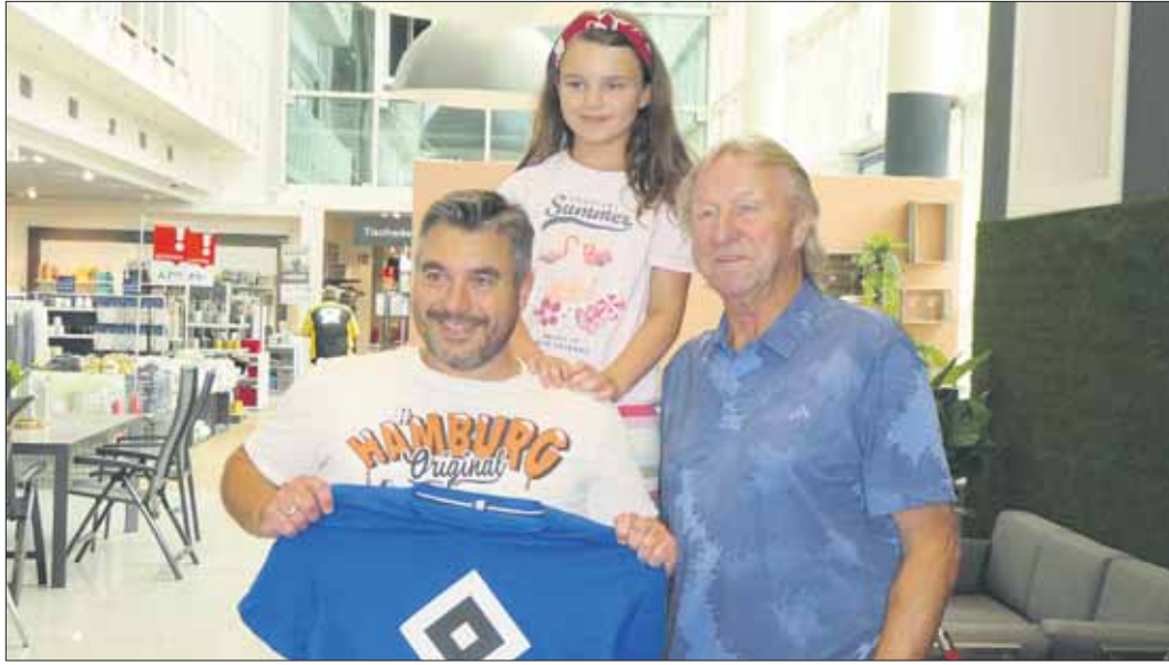
Aus Krupunder kamen diese leidenschaftlichen HSV-Fans und ließen sich das Trikot signieren