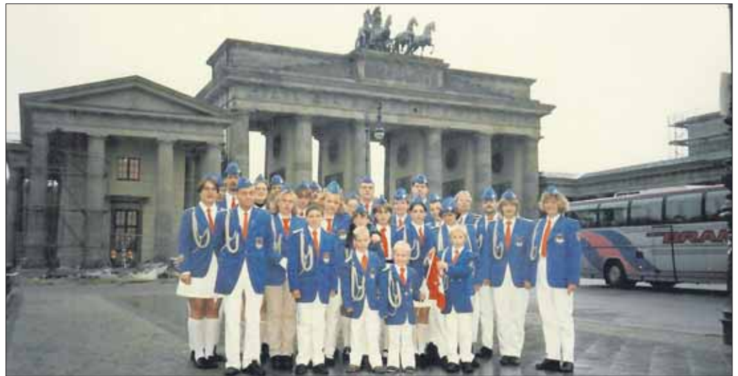
In Berlin vor dem Brandenburger Tor