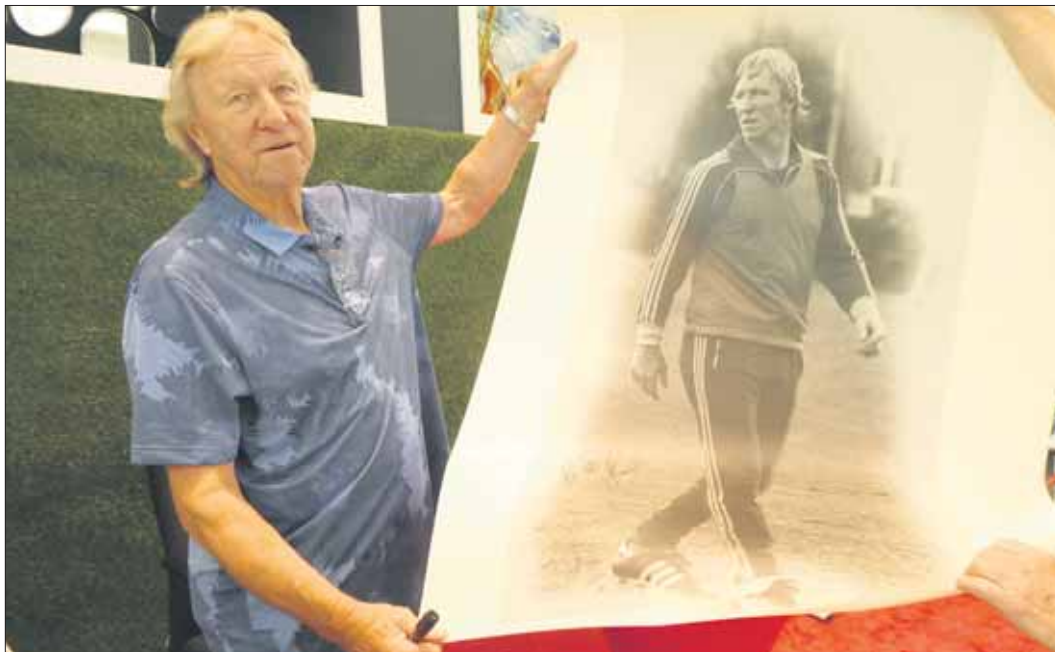
Ein Bild aus den Anfangszeiten beim HSV auf dem Trainingsplatz

Mit den Fans plauderte er in seiner netten und unkomplizierten Art, die ihn so sympathisch macht. Das führte auch zu den sportlichen Erfolgen im Vereinsfußball und den Nationalmannschaften im Damen- und Herrenfußball.