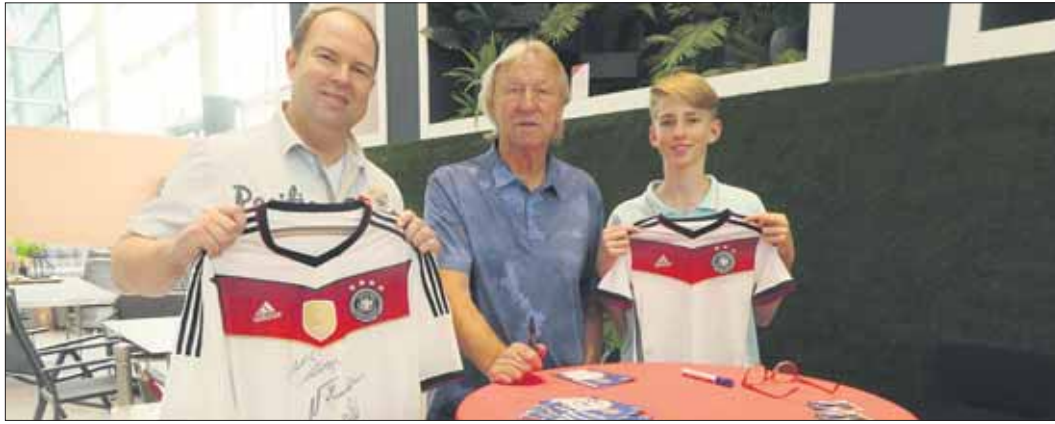
Zwei HSV-Fans aus Poppenbüttel ließen sich ein Autogramm auf das Nationaltrikot geben