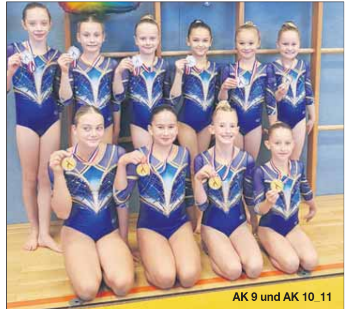
AK 9 und AK 10_11

In der AK 9 ging es besonders spannend zu. Drei der vier angetretenen Mannschaften hatten bereits eine Woche zuvor beim Käpt'n Braas Pokal gegeneinander geturnt. Trotz eines sehr guten Wettkampfs mussten die Schenefelderinnen den Kieler Turnerinnen diesmal den Vortritt lassen. Dennoch