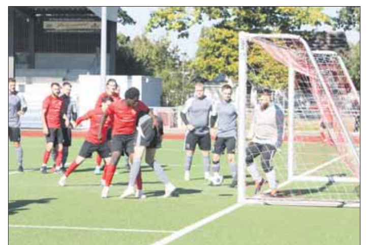
Aus dem Gewühl heraus entsteht das 2:0 für Lurup.