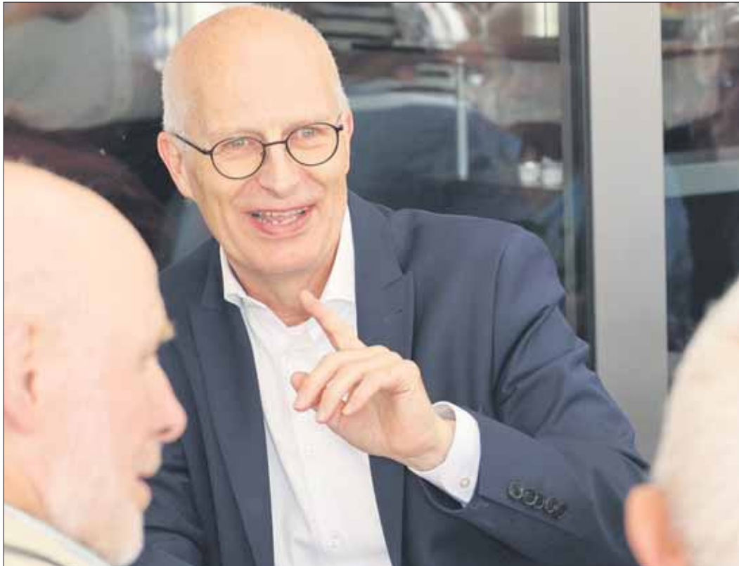
Hamburgs Bürgermeister Dr. Peter Tschentscher ist gern vor Ort und spricht mit den Bürgerinnen und Bürgern, wie hier beim Sommerfest der SPD in Lurup.