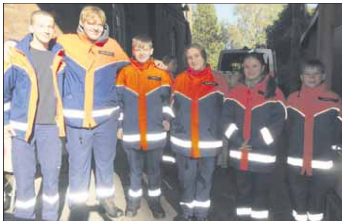
Waren auch beim Erntedankfest auf dem Heidbarghof mit dem Würstchengrill dabei – die Jugendfeuerwehr Osdorf