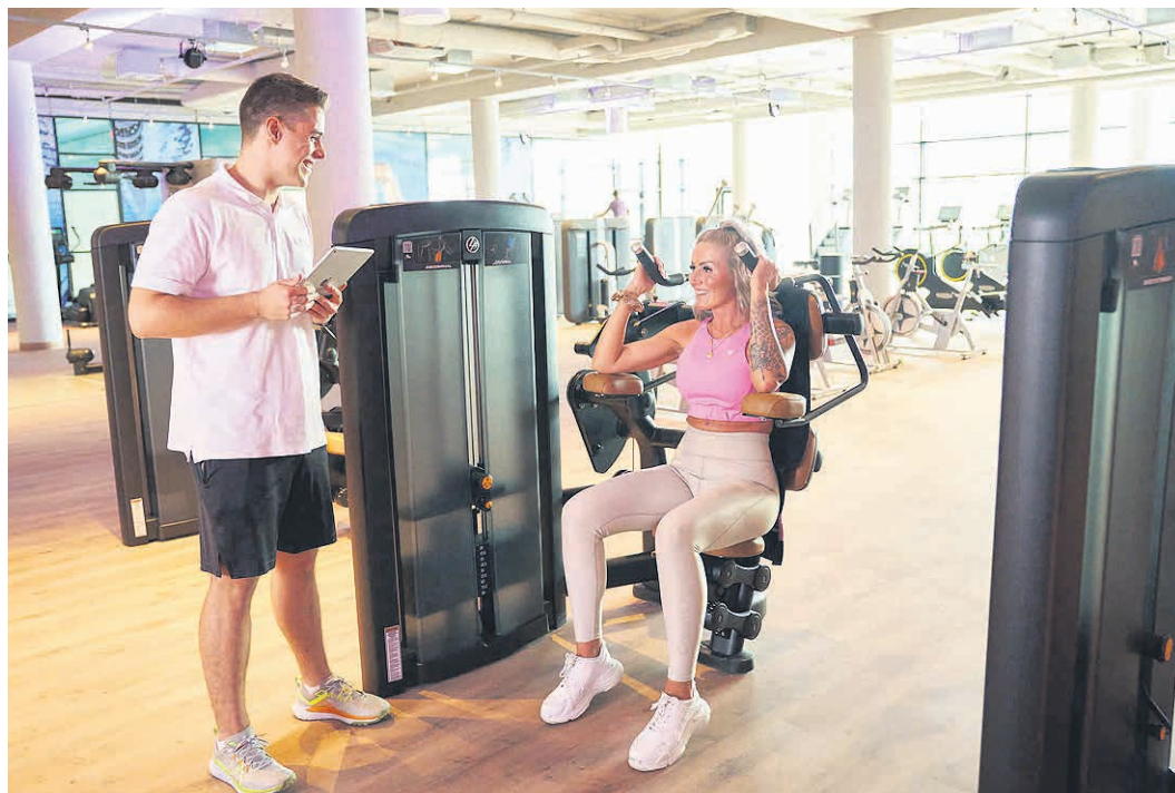
Der Sports Club unterstützt Sie durch erfahrene und kompetente Trainer/Innen auf dem Weg zu Ihrer Wunschfigur.

Fitnessstudio getraut haben, denn die Gesundheit ist bekanntermaßen unser höchstes Gut. Das Mega-Angebot gibt es ab sofort auf www.sports-club.de . Weitere Informationen, Anmelde-möglichkeiten und Kontaktdaten gibt es ebenfalls auf der Homepage oder kommen Sie einfach vorbei!