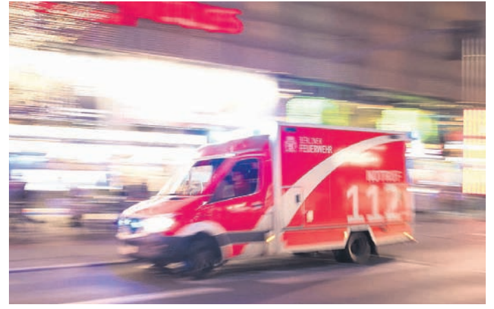
Ein Rettungswagen der Feuerwehr rast mit Blaulicht durch die Stadt