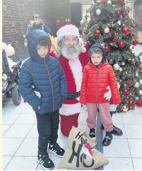
Der Weihnachtsmann kam am 24. Dezember auch ins Born Center und verteilte Überraschungen an die Kinder.