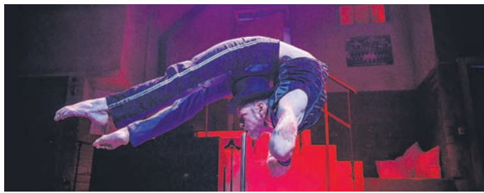
Schmidt Mitternachtsshow – Tigris