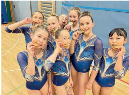
Die stolzen Turnerinnen von Blau Weiß 96 Schenefeld freuen sich über die Goldmedaille in der Kreisliga.