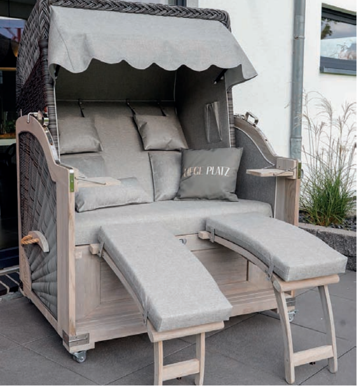
Die beliebten Strandkörbe bleiben Kern des Sortiments – perfekt abgestimmt auf die neuen Gartenmöbel.

eine zentrale Rolle: Das erfahrene Team der Manufaktur nimmt sich Zeit, individuelle Wünsche zu besprechen, Materialien zu vergleichen und maßgeschneiderte Lösungen für unterschiedliche Gartensituationen zu entwickeln.