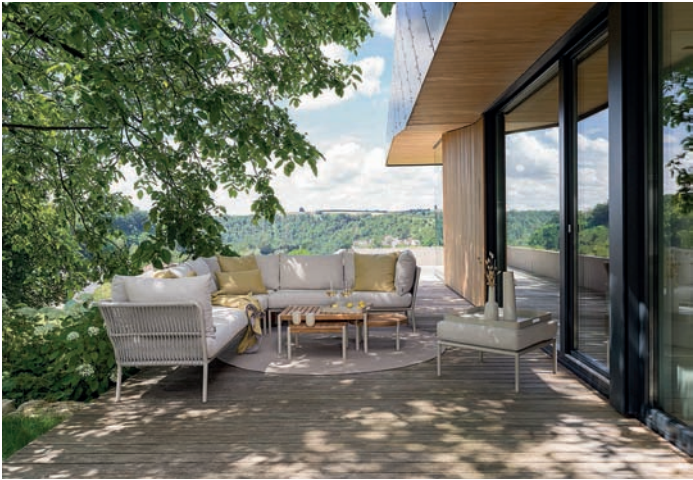
Neu im Programm: Hochwertige Gartenmöbel von Stern®