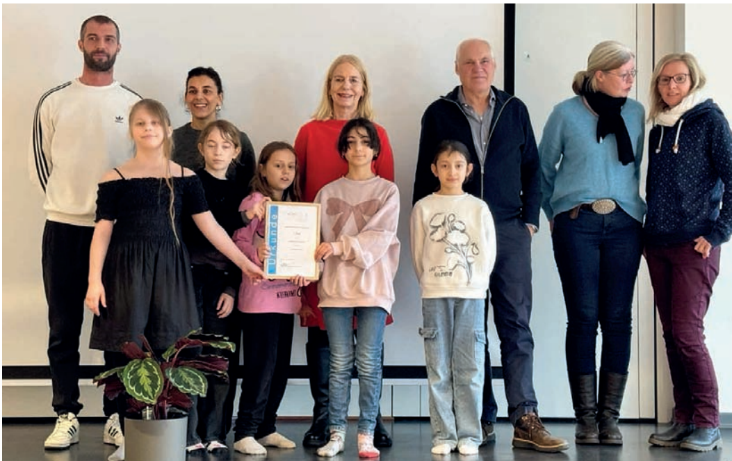
Am 13.2.2026 überreichte die Stiftung die Urkunde an das Gewinnerteam.

Wie funktioniert Demokratie eigentlich? An der Schule Langbargheide konnten die Kinder diese Frage nicht nur im Unterricht besprechen, sondern ganz praktisch erleben – mit allem, was dazugehört: Parteien, Wahlprogrammen, Wahlreden und einer echten Abstimmung. Die Schule hat es sich zum Ziel gesetzt, den Schüler:innen frühzeitig Mitbestimmung zu ermöglichen und ihnen zu zeigen, dass ihre Ideen ernst genommen werden. Zu Beginn des Schuljahres fand deshalb eine jahrgangsübergreifende Projektwoche zum Thema „Demokratie“ für die Klassen 3 und 4 statt. In gemischten Gruppen gründeten die Kinder eigene Parteien und entwickelten Namen, Logos und Wahlprogramme. Die Themen reichten von ‚Umweltschutz‘ über ‚mehr Bewegungsangebote‘ bis hin zu ‚gesunder Ernährung‘. Ein Höhepunkt der Woche waren die Wahlreden vor der gesamten Schüलगemeinschaft. Die Kinder präsentierten im Theater ihre Ideen und versuchten die anderen Kinder von ihren Standpunkten zu überzeugen. Anschließend wurde gewählt, Dafür gab es Wahlkabinen, Stimmzettel und im Anschluss fand eine Auszählung statt.