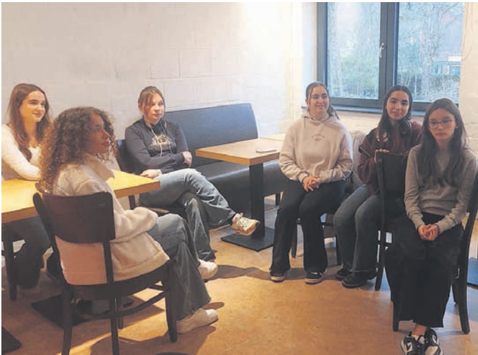
6 Mädchen des Gymnasiums Schenefeld wurden mit einer Urkunde der Stadt Schenefeld ausgezeichnet.

paare“ für den Nachmittag und Verteilung auf die freien Räume des JUKS. Der Zeitraum von maximal 1,5 Stunden für etwa 2-3 Fragen ist ausreichend. Gelerntes soll in einem Notizbuch für spätere Wiederholungen zuhause notiert werden, was leider noch nicht so gut klappt, die „lose-Zettel-Gruppe“ bei den Senioren ist stark vertreten. So gehen wichtige Informationen dann leider auch gern wieder verloren, wenn diese Zettel verschwunden sind. Die Zeit vergeht wie im Flug und am Ende trennen sich die Lerngruppen stets zufrieden und fragen nach neuen Terminen. Die aufgestellte Spendendose füllt sich regelmäßig. Am 8. Februar dieses Jahres gab es nun die Belohnung für die sechs fleißigsten jungen Ehrenamtlerinnen, eine Urkunde der Stadt Schenefeld für ihre tolle Arbeit, die sich ganz sicher bei späteren Bewerbungen positiv auswirken wird. Stadtpräsident Holm Becker überreichte die Urkunden der Stadt und drückte in seiner Rede noch einmal seine Begeisterung für dieses im Pinneberger Raum einzigartige Projekt aus. Glücklicherweise werden alle jungen Helferinnen trotz erhaltener Urkunde weitermachen, was für ein Glück für die Schenefelder Seniorinnen und Senioren! Aber die Gruppe der Schüler:innen und Schüler, die sich engagieren möchten, darf sich gern erweitern, Interessierte können sich beim Kinder- und Jugendbeirat melden. kjb_schenefeld_aktuell Die Seniorenliste hat sich inzwischen etwas verkleinert, die Gründe sind vielfältig. Einige hatten tatsächlich nur wenige