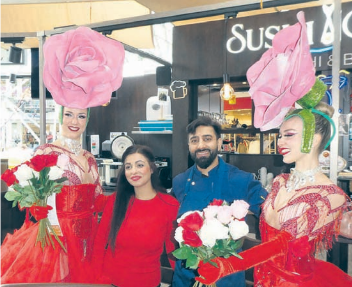
Blumige Aktion im Stadtzentrum: Die neuen Betreiber der Sushi-Bar und des „Schwarzen Tresen“ wurden am Valentinstag mit Blumen begrüßt.

Interaktive Stationen ermöglichen es, Technik nicht nur zu betrachten, sondern selbst zu erleben: Ein „gläserner Computer“ gibt Einblick in das Innenleben eines Rechners, ein Chipkartenlesegerät zeigt, welche Daten auf einer Karte gespeichert sind. So wird die rasante Entwicklung der