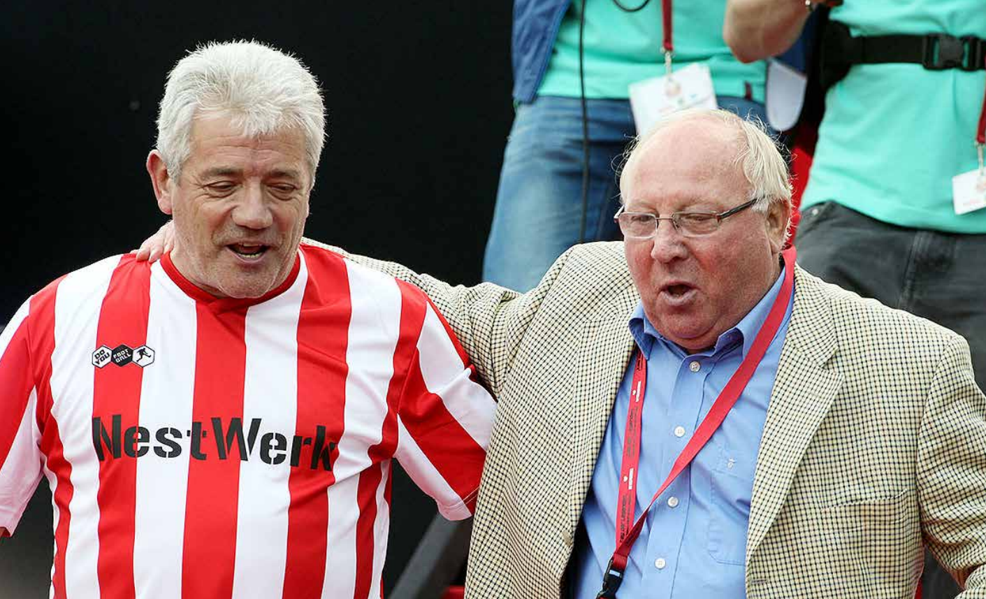
Zwei unvergessene Fußballer beim HSV: Kevin Keegan und Uwe Seeler (+). Sie trafen sich 2011 bei einem Legenden-Spiel für einen guten Zweck im Millerntorstadion