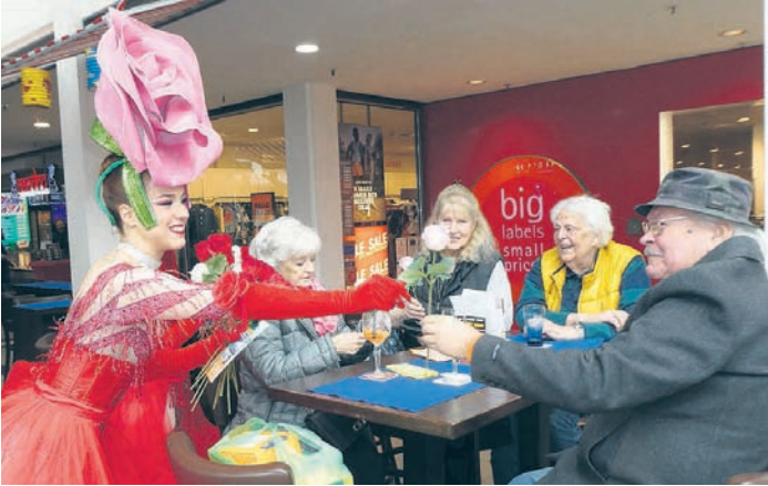
Auch die Gäste und Besucher wurden mit einer Rose beschenkt und freuten sich über diese Überraschung.

Mitmachen und gewinnen Begleitend zur Ausstellung gibt es ein Gewinnspiel. Wer die Fragen rund um die Exponate richtig löst und die Teilnahmekarte ausfüllt, nimmt an der Verlosung teil. Die Auslosung erfolgt zum Ende der Ausstellung.