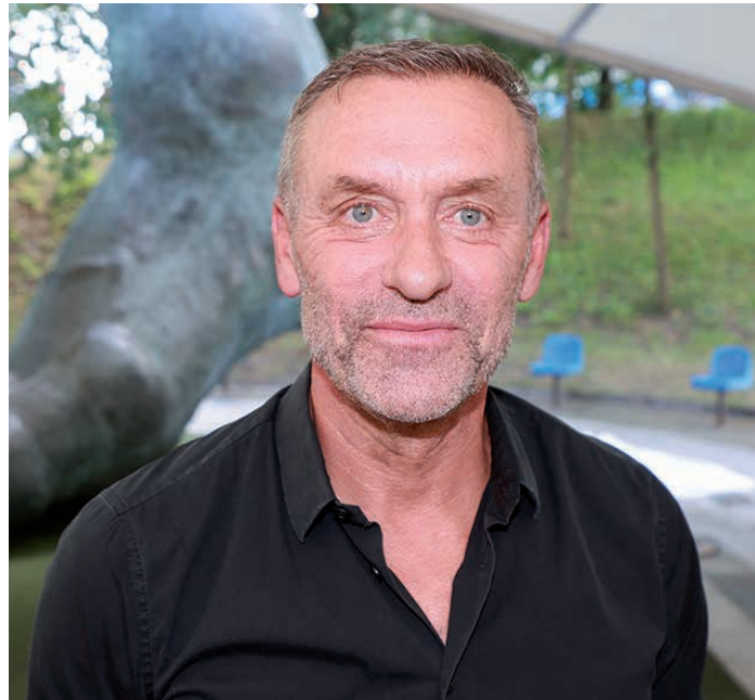
Thomas Doll auf dem „Walk of Fame“ am Uwe-Seeler-Fuß

Die ungarische Hauptstadt ist dabei zu einer weiteren Heimat geworden und bildet bis heute seinen Lebensmittelpunkt. Dort lebt Thomas Doll heute mit seiner Frau und seiner jüngsten Tochter.