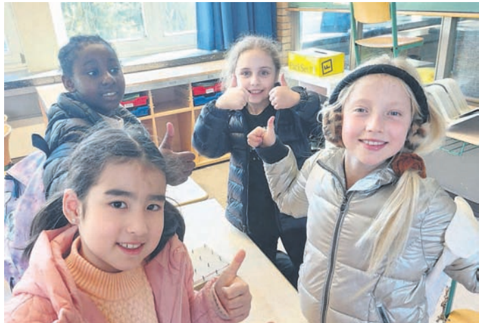
Lana + Mia + Inara + Sky

Am Samstag, den 11. April, strömten wieder 240 Schüler und Schülerinnen in die Fridtjof-Nansen-Schule im Fahrort. Freiwillig wollten sie am Wochenende lernen und sich den Kopf heiß rechnen: Das Mathesams lud in die Schule ein und zog bereits im 15. Jahr zahlreiche Familien Lurups an. Um 10.00 Uhr standen alle Teams bereit, ausgerüstet mit Stationszettel und guter Laune. Bei schönstem Frühlingwetter liefen die Kinder in ihren vorher festgelegten Gruppen über den Schulhof und suchten nacheinander 12 Klassenräume auf. In jedem erwartete sie eine andere