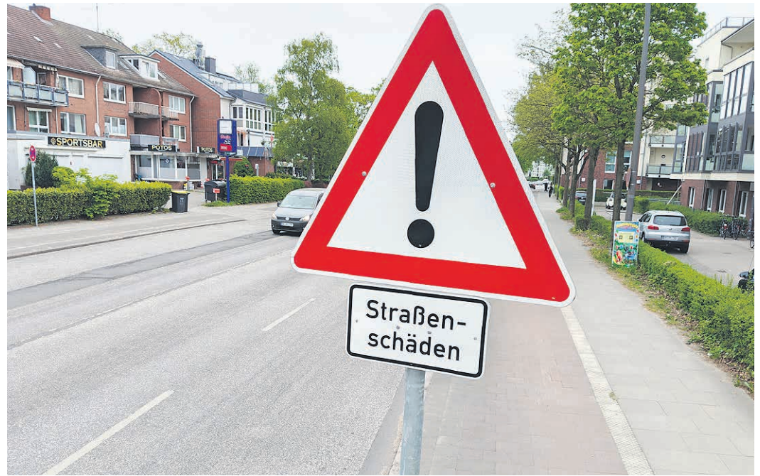
Die Luruper Hauptstraße weist seit längerem Schäden auf. Für den Sommer 2026 ist nun eine Instandsetzung der Fahrbahn angekündigt.

Die Luruper Hauptstraße soll nach Angaben des Senats im Abschnitt zwischen Wilsdorfallée und Landesgrenze vom 27. Juli bis 21. August 2026 instandgesetzt werden. Das geht aus der Antwort des Senats auf eine Schriftliche Kleine Anfrage des SPD-Bürgerchaftsabgeordneten Frank Schmitt hervor. „Die Luruper Hauptstraße weist seit geraumer Zeit erhebliche Schäden auf. Ich begrüße deshalb, dass die Fahrbahn nun in diesem Abschnitt instandgesetzt werden soll. Die große und langfristige Lösung für die Entwicklung der Luruper Hauptstraße bleibt wichtig, aber wir können nicht warten, bis alle städtebaulichen und verkehrlichen Fragen abschließend geklärt sind“, so Frank Schmitt. Gerade nach den Wintermonaten werde immer wieder deutlich, wie stark die Straße inzwischen beansprucht sei. Deshalb sei es richtig, mit der nun vorgesehenen Fahrbahninstandsetzung weiteren Schäden vorzubeugen und die Infrastruktur in Stand zu halten. „Wenn wir vermeiden wollen, dass sich im nächsten Winter neue Schlaglöcher bilden und der Zustand der Straße weiter schlechter wird, dann muss jetzt gehandelt werden“, erklärt Frank Schmitt. Nach Angaben des Senats ist für die Bauzeit eine Einbahnstraßenregelung in Fahrtrichtung stadtauswärts vorgesehen. Der Busverkehr