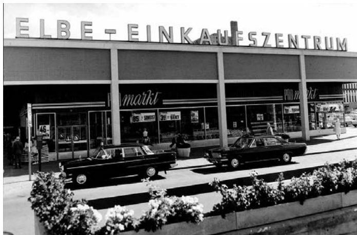
ELBE Einkaufszentrum 1966