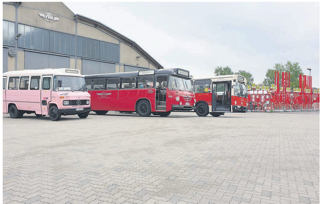
Zum Einsatz kommen liebevoll restaurierte Fahrzeuge aus der historischen Sammlung von vhh.mobility.

Zum Einsatz kommen liebevoll restaurierte Fahrzeuge aus der historischen Sammlung des Unternehmens. Darunter befinden sich ein Büssing Präsident 14 aus dem Jahr 1964, ein Daimler-Benz O 305 aus dem Jahr 1984 sowie die bekannte „Bergziege“, ein Daimler-Benz O 309 D aus dem Jahr 1981, die im historischen Schnellbus-Rosa einst auf der traditionsreichen Linie 48 (heute 488) durch