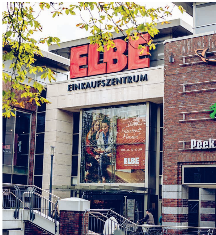
ELBE Einkaufszentrum 2026