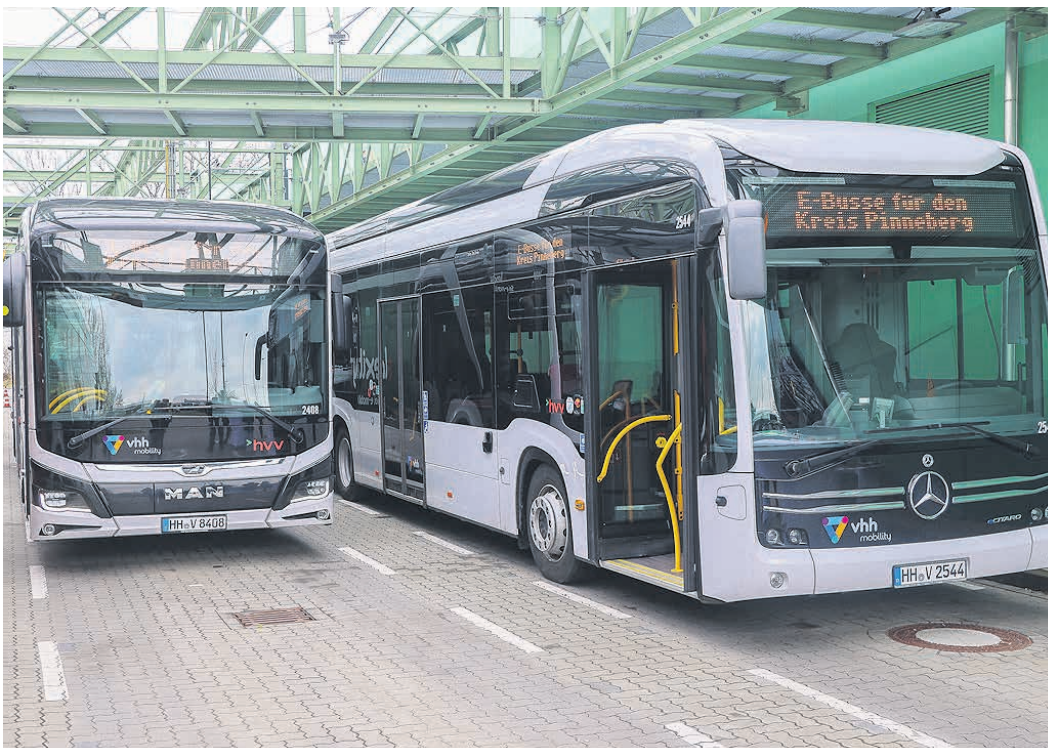
vhh.mobility bringt weitere 10 E-Busse im Kreis Pinneberg in den Linienbetrieb.