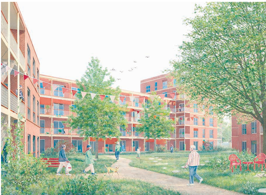
Visualisierung Wohnungsprojekt Baudissin Kaserne

© Credits „LRW Architektur und Stadtplanung“