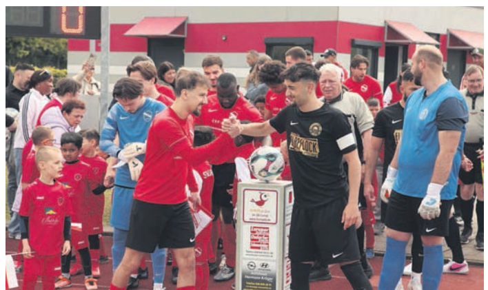
Familientag beim SV Lurup