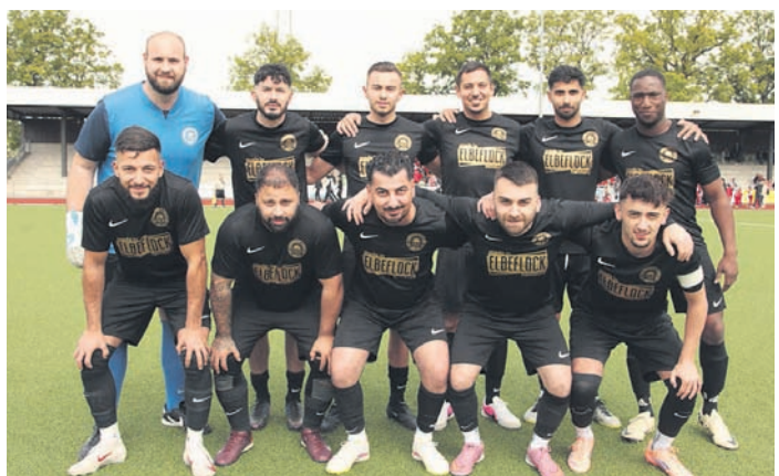
Die Mannschaft der Gäste aus Eidelstedt