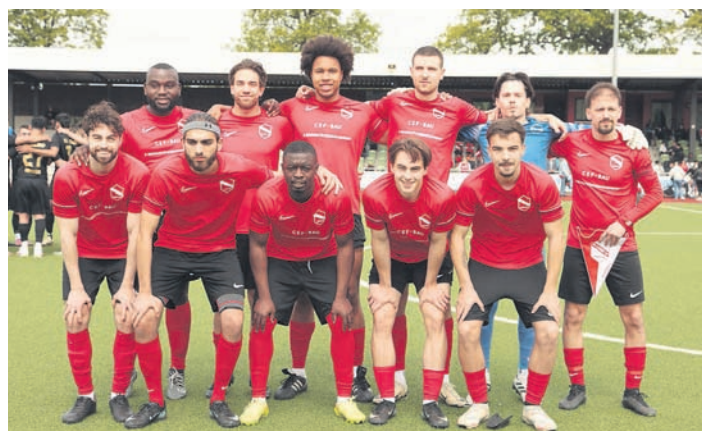
Das Team des SV Lurup