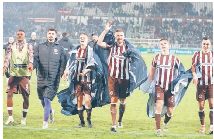
Nach einem Sieg gegen den VfB Stuttgart wurde gejubelt.

des FC St. Paulis auch etwas Positives abgewinnen. Eine Zuschauerin auf der Gegengeraden: „Klasse! Endlich gewinnen wir auch mal wieder Spiele!“ Natürlich wird auch in der 2. Bundesliga attraktiver Fußball gespielt, aber die 1. Liga muss das Maß aller Dinge sein. Das Ziel in der kommenden Saison für den FC St. Pauli kann also nur lauten: sofortiger Wiederaufstieg in die 1. Bundesliga! Forza FC!