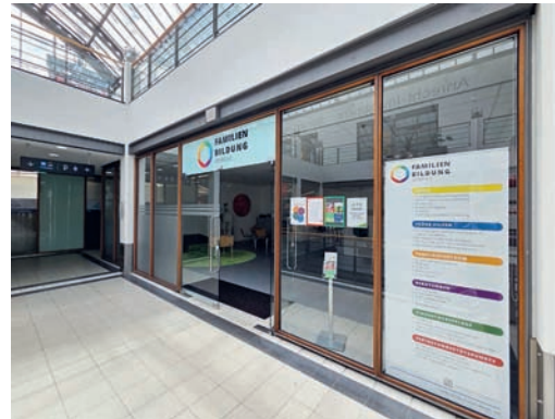
Blick auf die neuen Räumlichkeiten