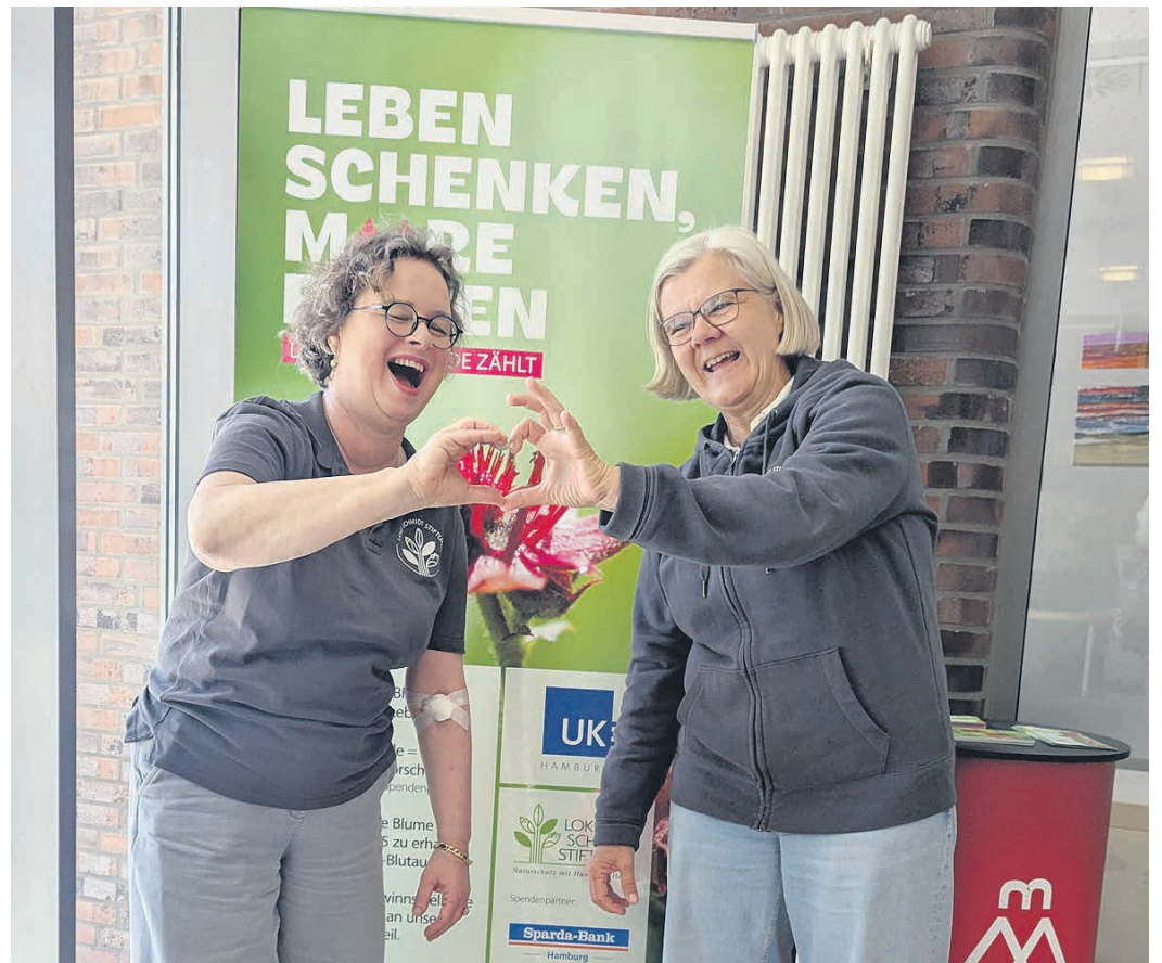
Das Team der Loki Schmidt Stiftung zeigt, dass Blutspenden nicht nur Leben rettet, sondern als gemeinsame Aktion auch Spaß macht

Der erste Meilenstein ist geschafft: 10.288 Blutspenden wurden bis Ende April im UKE gegeben. Mehr als 20.000 Blutspenden sollen es insgesamt in diesem Jahr werden, das haben sich die beteiligten Initiativen zum Ziel gesetzt – und gehen mit gutem Beispiel voran: Ein Team der Loki Schmidt Stiftung krepelte bei einem gemeinsamen Termin im UKE im Mai die Ärmel hoch und spendete Blut. Es war bereits die vierte gemeinsame Blutspende der Stiftung seit Beginn der Aktion. Jede Blutspende tut doppelt Gutes: Sie rettet Leben und schützt bedrohte Lebensräume. Die Sparda-Bank Hamburg stellt für jede Blutspende 1 € für die Moorschutzarbeit der Loki Schmidt Stiftung in fünf Bundesländern bereit. „Leben schenken, Moore retten: Deine Blutspende zählt!“ findet bereits das zweite Jahr in Folge statt. Von Mai bis Dezember 2025 kamen 20.599 Blutspenden und damit 20.000 € für den Moorschutz zusammen. Schirmherr Kostja Ullmann: „Es gibt Themen, bei denen Wegschauen keine Option ist. Blutspenden und Naturschutz gehören für mich dazu. Beides funktioniert nur, wenn Menschen Verantwortung übernehmen und nicht darauf warten, dass andere es tun. Es sind Entscheidungen, die vielleicht