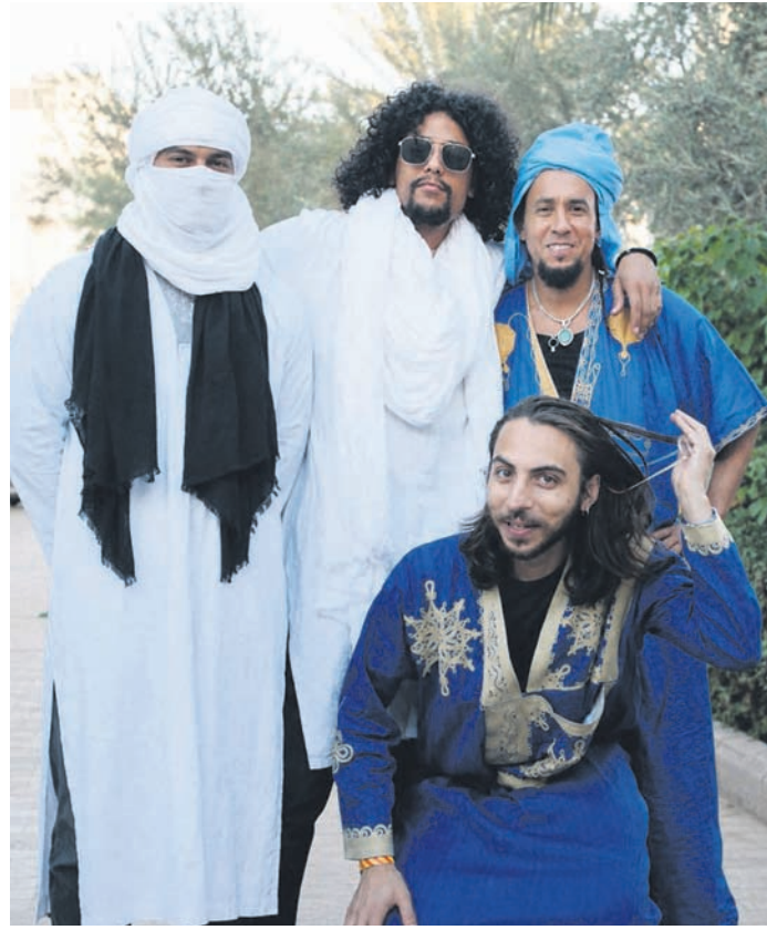
Spine of the Sahara um 15:20 Uhr

stuf dem Stadtteilcampus soll Menschen zusammenbringen, Raum für Begegnung schaffen und den Sommer mit einem vielfältigen Programm bereichern.