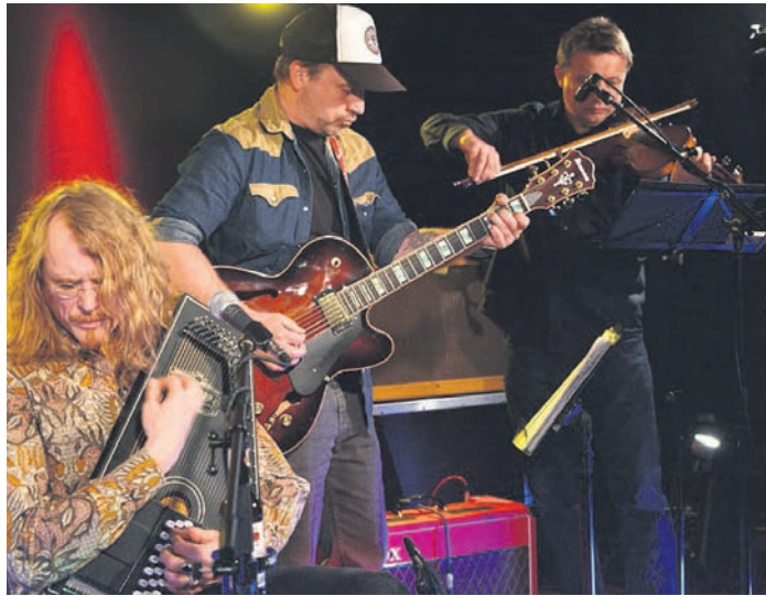
Ride Lonesome um 13:30 Uhr