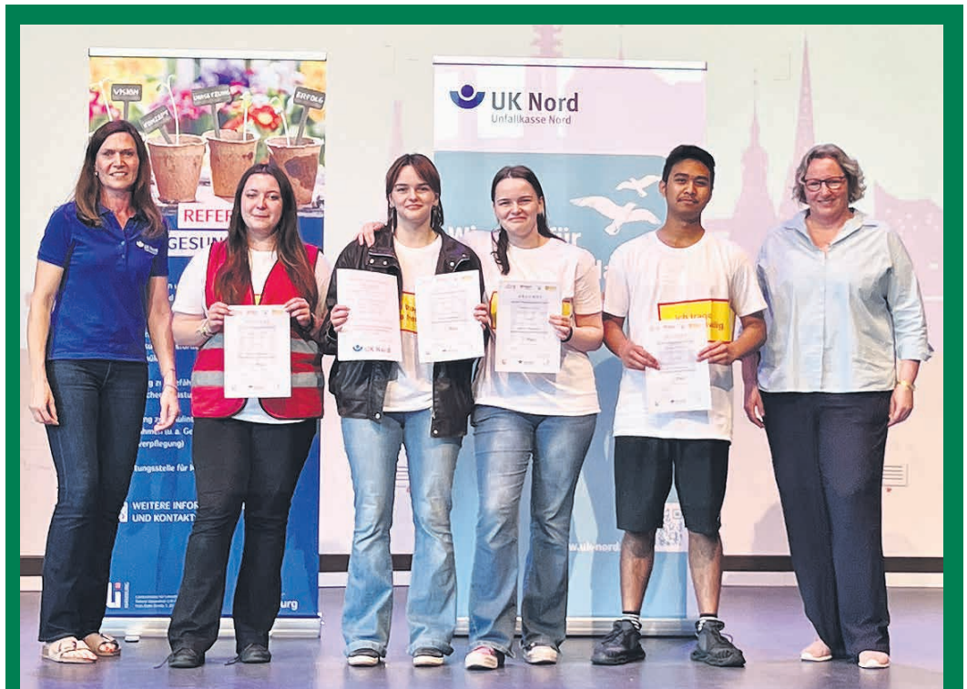
Großer Erfolg für die Schulsanitäterinnen und Schulsanitäter der Geschwister-Scholl-Stadtteilschule aus Osdorf: Beim 16. Hamburger Wettbewerb der Schulsanitätsdienste am 18. Juni 2026 im Emilie-Wüstenfeld-Gymnasium sicherte sich das Team den 1. Platz. Mit herausragenden 241 Punkten setzte sich das Quartett gegen insgesamt 23 weitere Teams durch und gewann zudem ein Preisgeld von 300 Euro. Lesen Sie den ausführlichen Bericht im Innenteil dieser Ausgabe.

Die U5 kommt – auch in den Westen Hamburgs. Die Stadt hat den Auftrag erteilt: Die U5 wird nach Lurup und Osdorf verlängert (wir berichteten darüber). Sie soll auf einer Länge von rund vier Kilometern und zwei Haltestellen westlich der Arenen im Volkspark nach Lurup und Osdorf verlängert werden. Ursprünglich sollte sie an den Arenen enden. Damit wird eine lang ersehnte Vision Wirklichkeit: 37.000 Bewohnerinnen und Bewohner in Lurup und 26.000 Osdorferinnen und Osdorfer profitieren von der Schienenanbindung. Die U5 wird mit 24 Haltestellen 29 km lang. Sie wird die am meisten genutzte U-Bahnlinie in Hamburg sein. Mit dem Bau der Strecke von Bramfeld bis City Nord wurde 2022 begonnen. Anwohnerinnen und Anwohner sowie Interessierte hatten am 18. Juni in Lurup und am 22. Juni im Osdorfer Born die Gelegenheit, sich zu informieren, Fragen zu stellen sowie ihre Ideen und Anregungen einzubringen. Mit ihnen wurde auch die Festlegung der beiden Haltestellen in Lurup (Lüttkamp vor dem Lurup Center) und Osdorf (Kroonhorst am Born Center) diskutiert. Von Osdorf aus gibt es auch die Option einer Verlängerung der Strecke nach Schenefeld – zumindest wird das nicht ausgeschlossen. Wenn alles nach Plan läuft, erhalten mit der Fertigstellung der U5-Strecke im Jahr 2040 über 50.000 Menschen endlich einen Schnellbahnschluss. Rund 29 Kilometer Strecke,