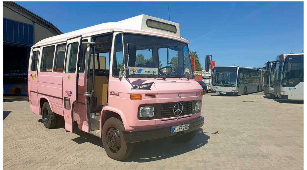
Die rosa Bergziege kommt wieder nach Blankenese.

1990 übernahm die Pinneberger Verkehrsgesellschaft (PVG) die Buslinien durchs Blankeneser Treppenviertel, womit auch die dort eingesetzten Kleinbusse den Eigentümern wechselten und nach Schenefeld versetzt wurden. Nun hörte der Wagen auf die Betriebsnummer „249“ und