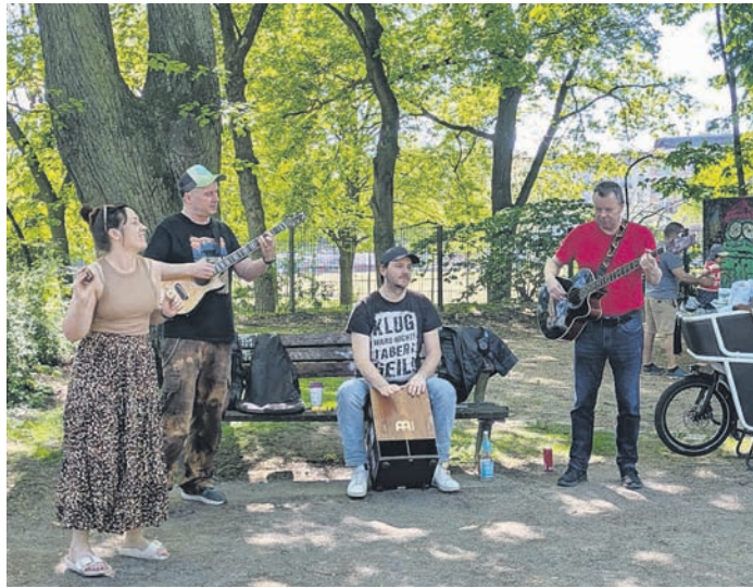
Wir Nicht! um 14:30 Uhr