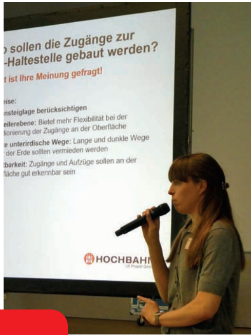
Bürgerbeteiligung bei der Vorstellung: