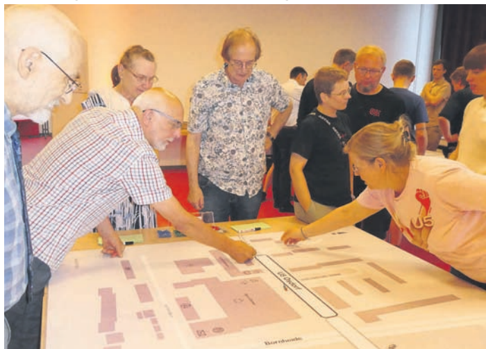
Lesen Sie den ausführlichen Bildbericht auf Seite 3.

lich – von Lurup ist man dann in der Innenstadt in 22 Minuten, zur Universität benötigt man von Osdorf statt 43 nur noch 20 Minuten, zum UKE in Eppendorf statt einer Dreiviertelstunde nur noch 13 Minuten. Die Einbindung und Beteiligung der Bürgerinnen und Bürger in den Stadtteilen soll auch in Zukunft fortgesetzt werden und es wird weitere Beteiligungs-Veranstaltungen geben, bei denen man alles über die Pläne erfährt und auch noch eigene Ideen einbringen kann.