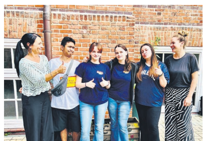
So sehen Siegerinnen aus