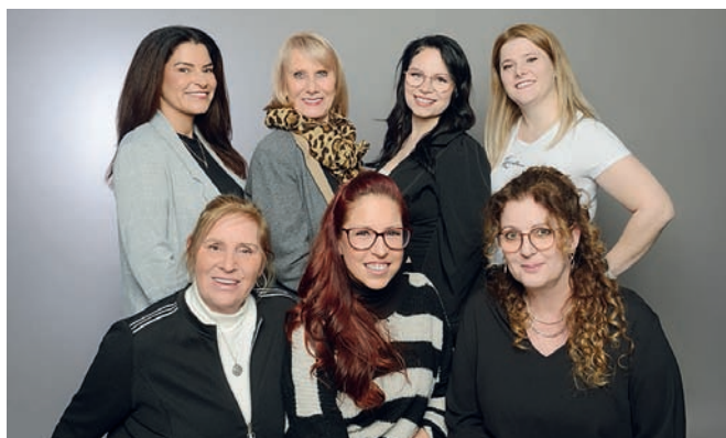
Unser creatives Team

Ihr perfektes Haarstyling wartet auf Sie!