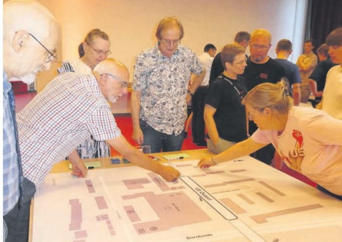
Lesen Sie den ausführlichen Bildbericht auf Seite 3.

lich – von Lurup ist man dann in der Innenstadt in 22 Minuten, zur Universität benötigt man von Osdorf statt 43 nur noch 20 Minuten, zum UKE in Eppendorf statt einer Dreiviertelstunde nur noch 13 Minuten. Die Einbindung und Beteiligung der Bürgerinnen und Bürger in den Stadtteilen soll auch in Zukunft fortgesetzt werden und es wird weitere Beteiligungs-Veranstaltungen geben, bei denen man alles über die Pläne erfährt und auch noch eigene Ideen einbringen kann.